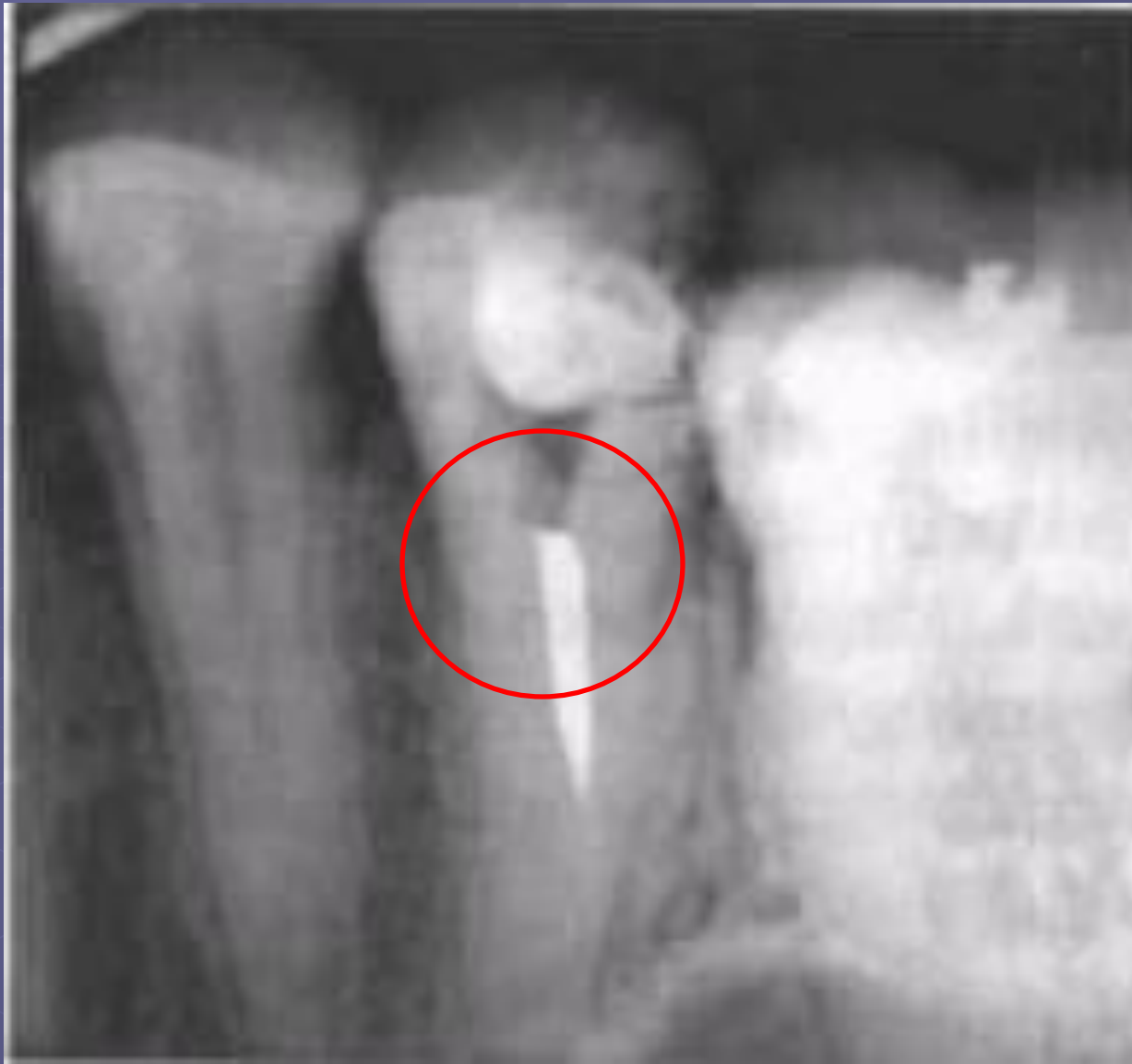
Некачественное пломбирование КК