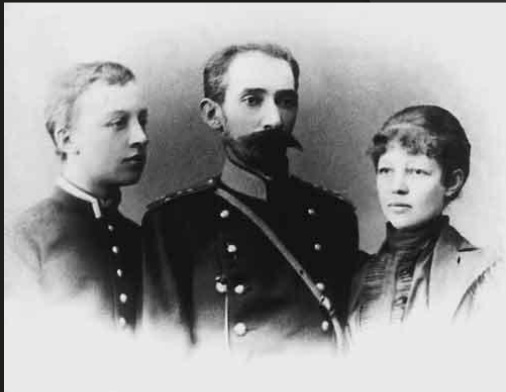
А.Блок с матерью и отчимом. Петербург. 1895