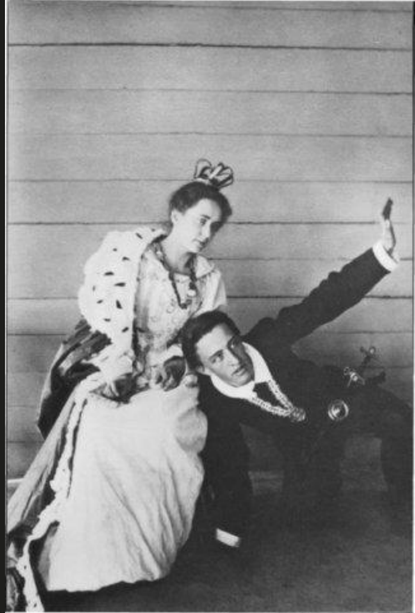
Домашний театр Гамлет

Зима 1897г. Блок мечтает стать актером, он увлечен игрой В. П. Далматова и М. А. Дальского, занимается декламацией и мелодекламацией, участвует в любительских спектаклях. Изучает роль Ромео. Декламирует стихи А. А. Фета, А. К. Толстого, Я. П. Полонского, А. Н. Апухтина.