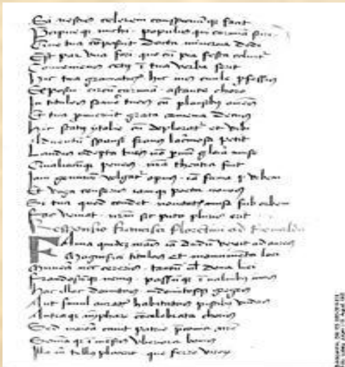
Manuscript, BN 10 10000111 100 10000111

Основна маса творів Петрарки написана на латині. Найвідоміші твори: поема „Африка”; лірична збірка „Буколіки”; автобіографія „Лист до нащадків”, філософський трактат „Моя таємниця, або Книга бесід про презирство до світу” (1343), цикл дидактичних поем („Тріумф кохання”, „Тріумф цноти”, „Тріумф Смерті”, „Тріумф Слави”, „Тріумф Часу”, „Тріумф Вічності”);