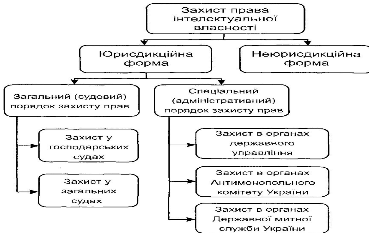
Форми та порядки захисту прав інтелектуальної власності