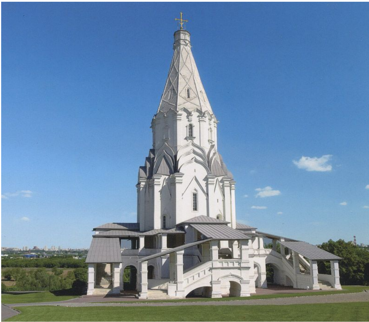
Церковь Вознесения в Коломенском (1530г.) Кремля (1508г.)