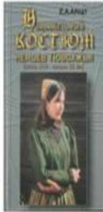
книга Е.А. Арндт