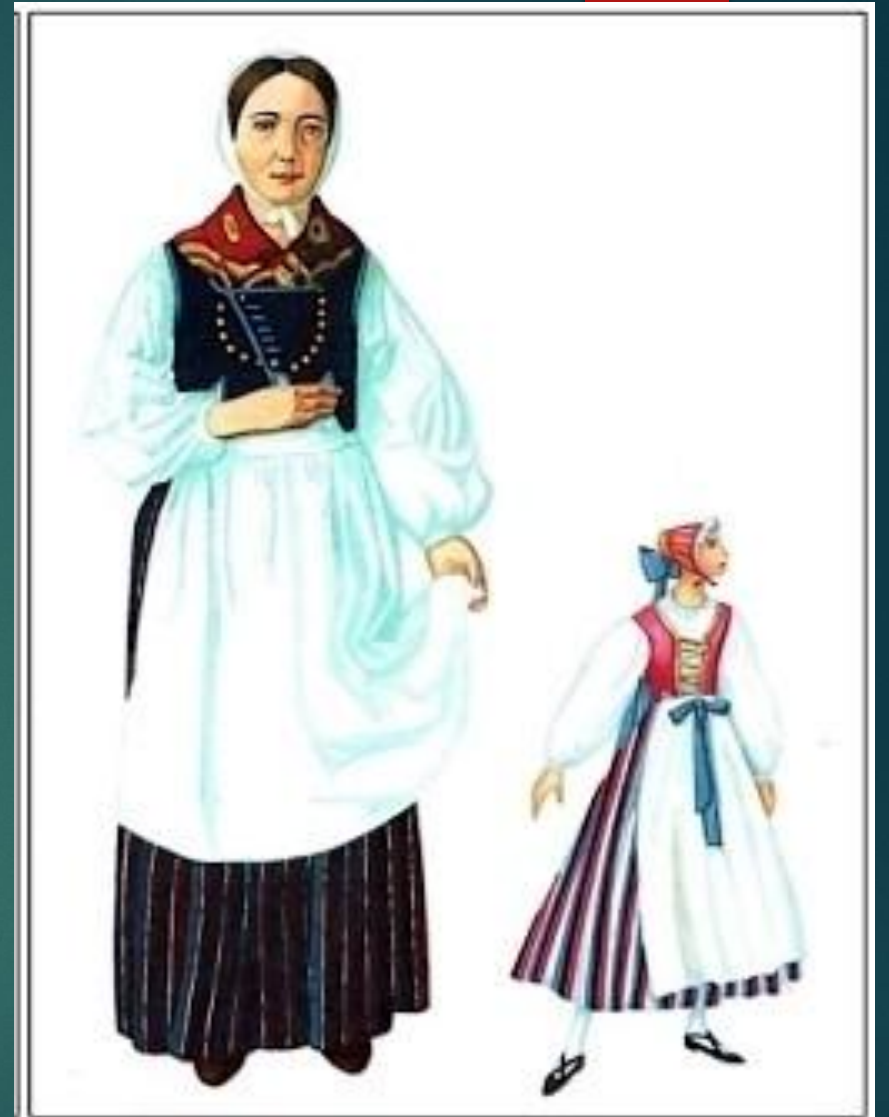
Б. Варианты костюмов поволжской немки. Начало XIX века. Реконструкция

Женский костюм также был немногосложен. Летом - сорочка и шерстяная юбка из самотканной ткани, в праздники, кроме того, белые бумажные чулки и башмаки, а сверх сорочки надевался еще лифчик из пестрой материи у молодых женщин и из темной у старух. На голове бумажная или легкая шерстяная шаль с яркими рисунками. Только в конце шестидесятых годов появились свободные кофточки без талии. Зимой: шерстяные синие чулки, валяные высокие туфли с красной каймой из гаруса, стеганный ватный лифчик, две-три юбки, а на голове теплая шаль по большей части также синего или черного цвета. Для выхода сверх лифчика надевалась еще плотно облегающая, короткая стеганая на вате кофточка и только в сильные морозы полушубок без воротника с высокой талией.