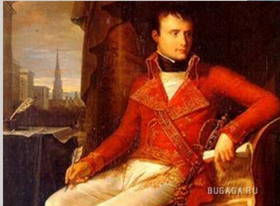
Первый консул – Бонапарт