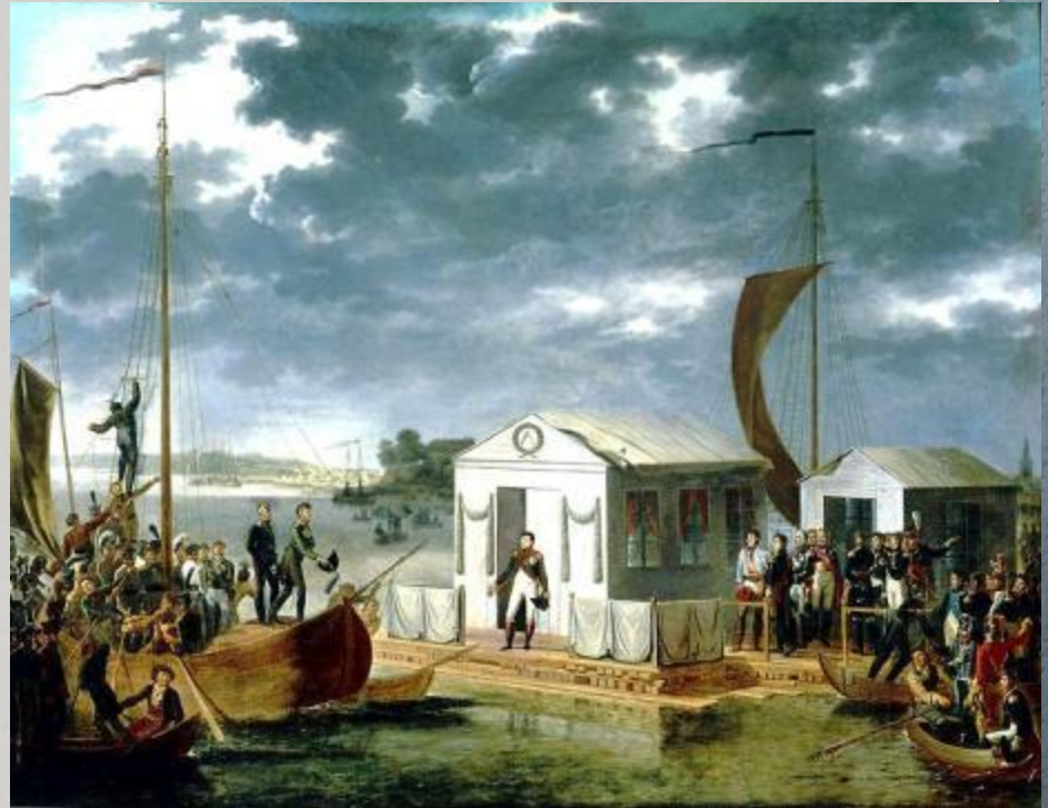
Встреча императоров в Тильзите

Наполеон заклучил мир с Россией. Два императора встретились в Тильзите . На плоту они обменялись рукопожатиями и подписали мирный договор.