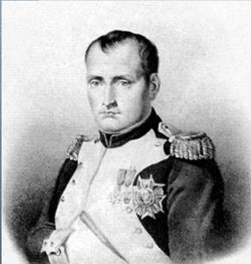
Первый консул – Бонапарт

Наибольшими правами обладал Первый консул, который мог объявлять войну и заключать мир, издавать законы, назначать и смещать министров