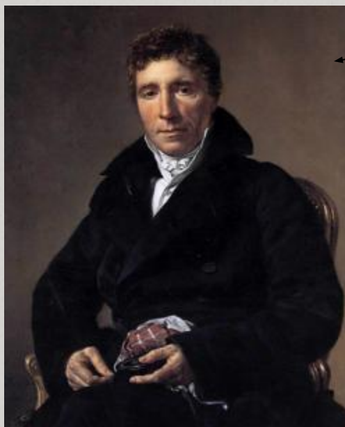
2 консул Эммануэль – Жозеф Сийес