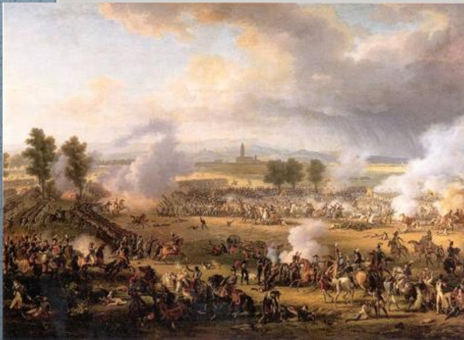
Битва при Маренго