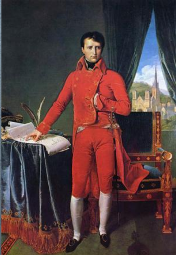
Первый консул – Бонапарт

В годы правления Наполеона экономическое положение государство ухудшилось: