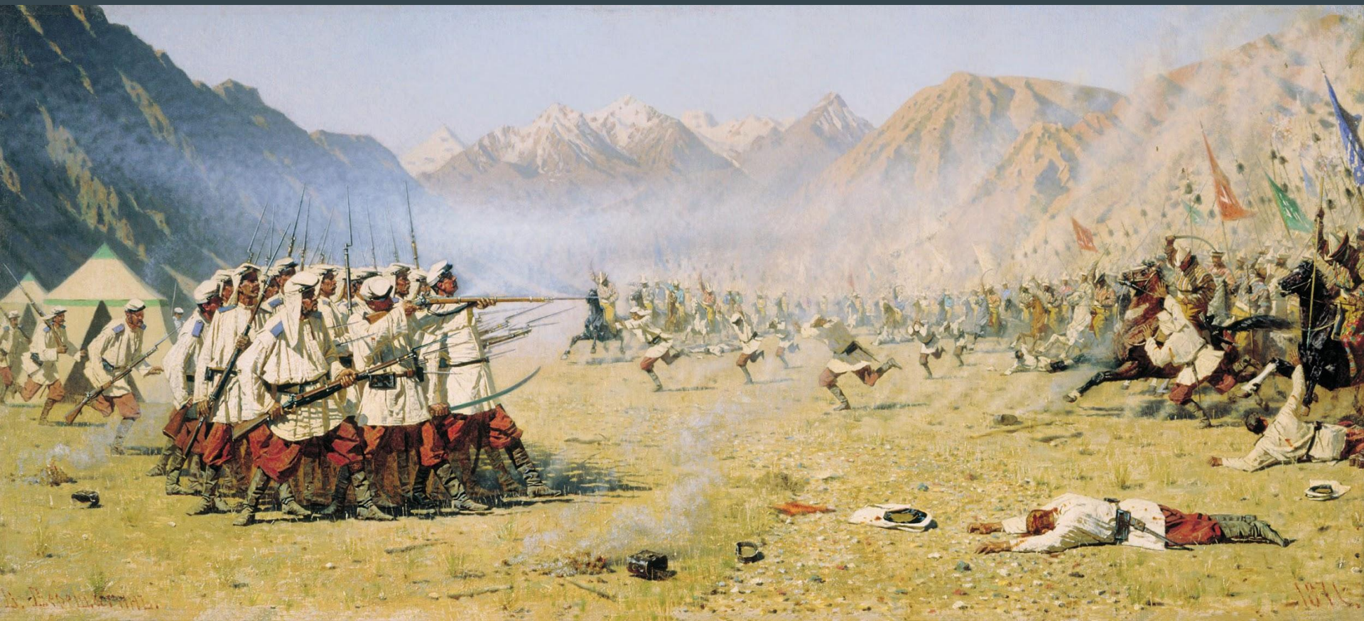
«Нападают врасплох». Картина В. В. Верещагина , 1871 г.