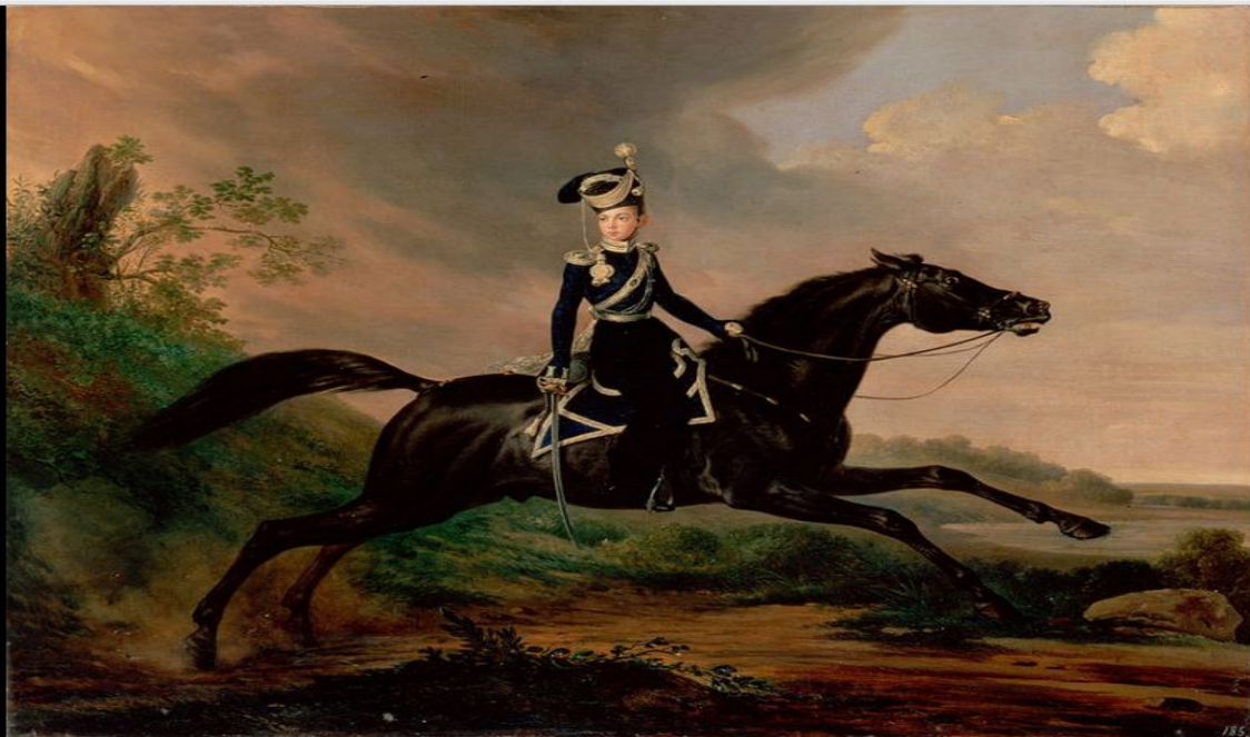
Портрет Александра Николаевича в юности