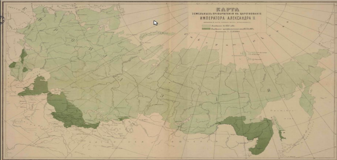
Территориальные приобретения при Александре II