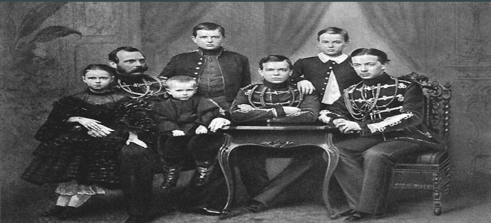
Александр II с детьми