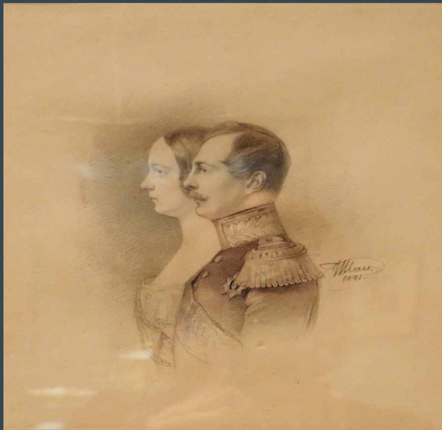
Мария Александровна и Александр II.