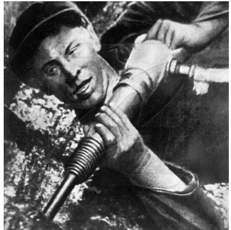
А. Г. Стаханов

массовое движение новаторов социалистического производства — рабочих, колхозников, инженерно - технических работников, многократно превышавших установленные нормы производства.