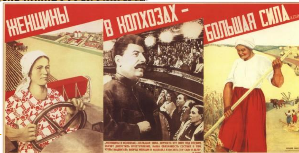
387. Гинус Н. Женщины в колхозах — большая сила. И. Сталин, 1933