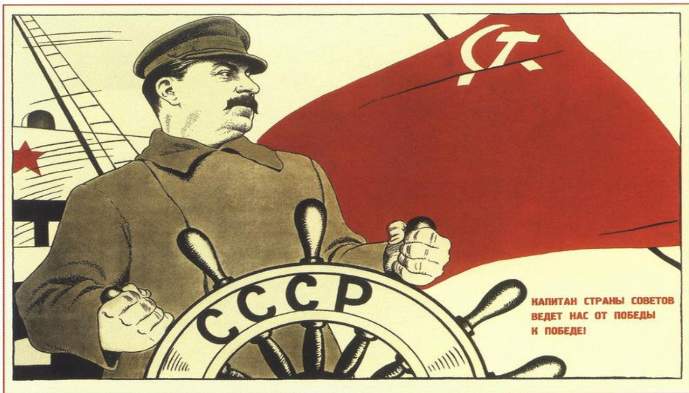
92. Ефимов Б. Капитан Страны Советов ведет нас от победы к победе! 1933