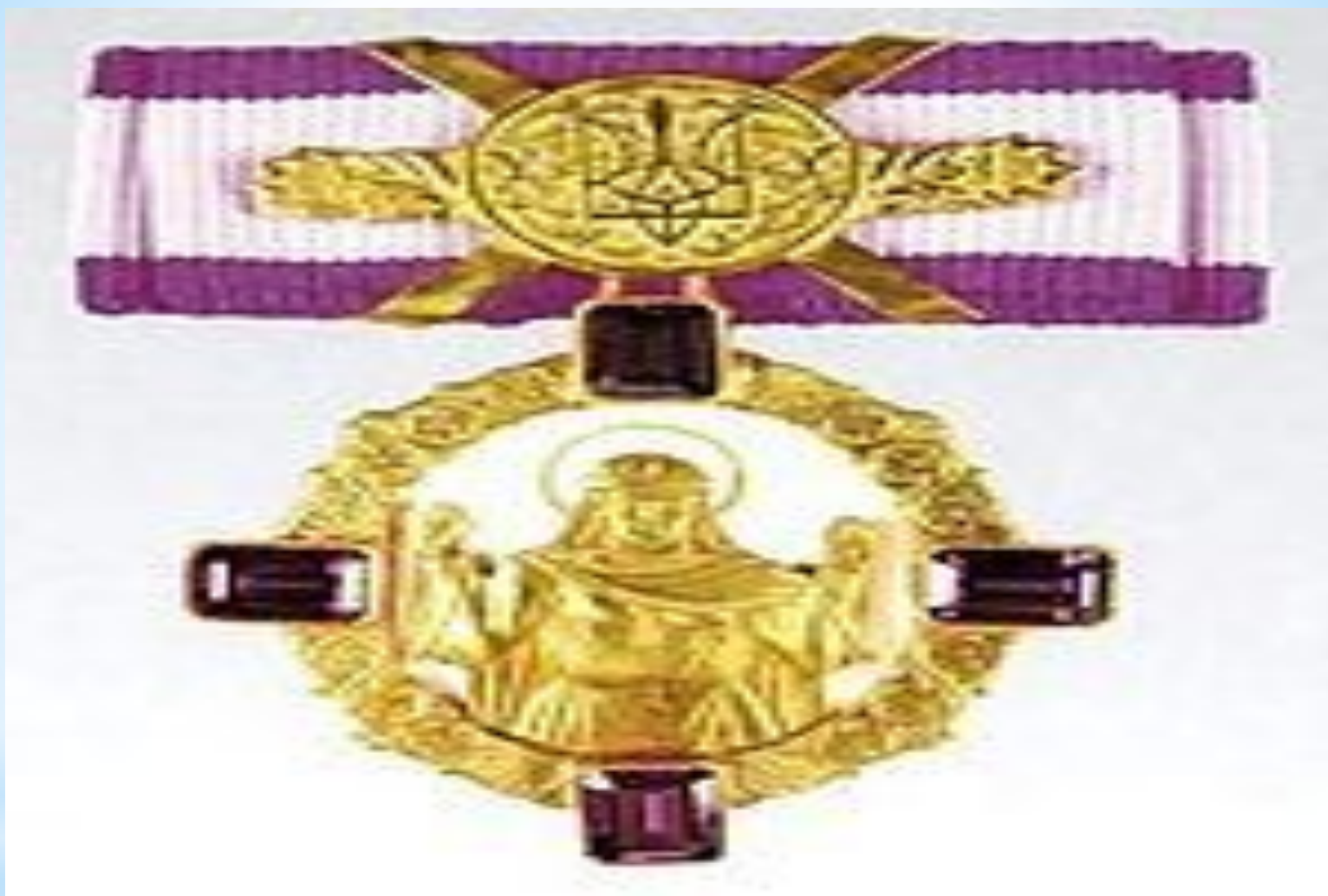
Орден княгини Ольги / степени