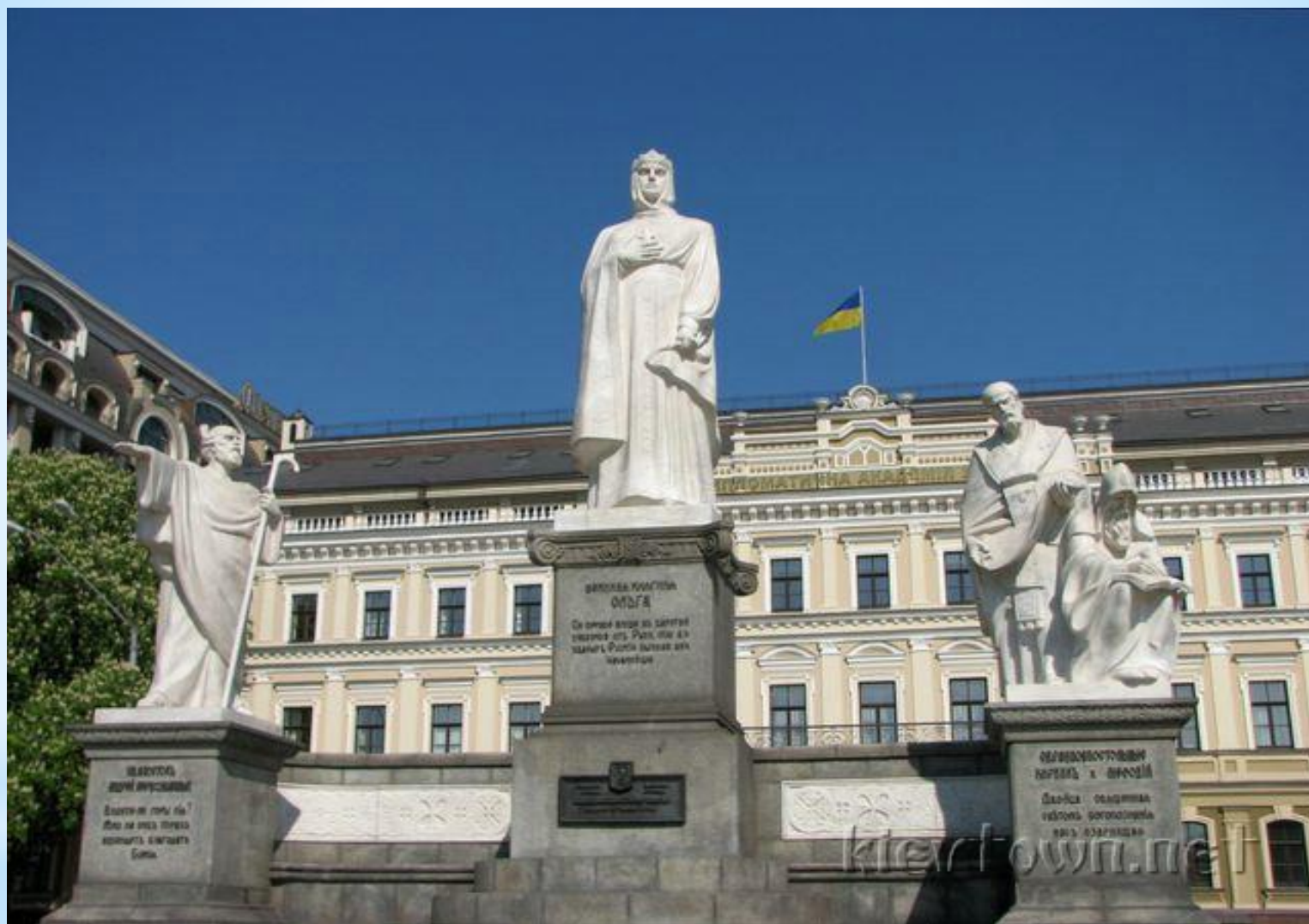
Памятник княгине Ольге в Киеве