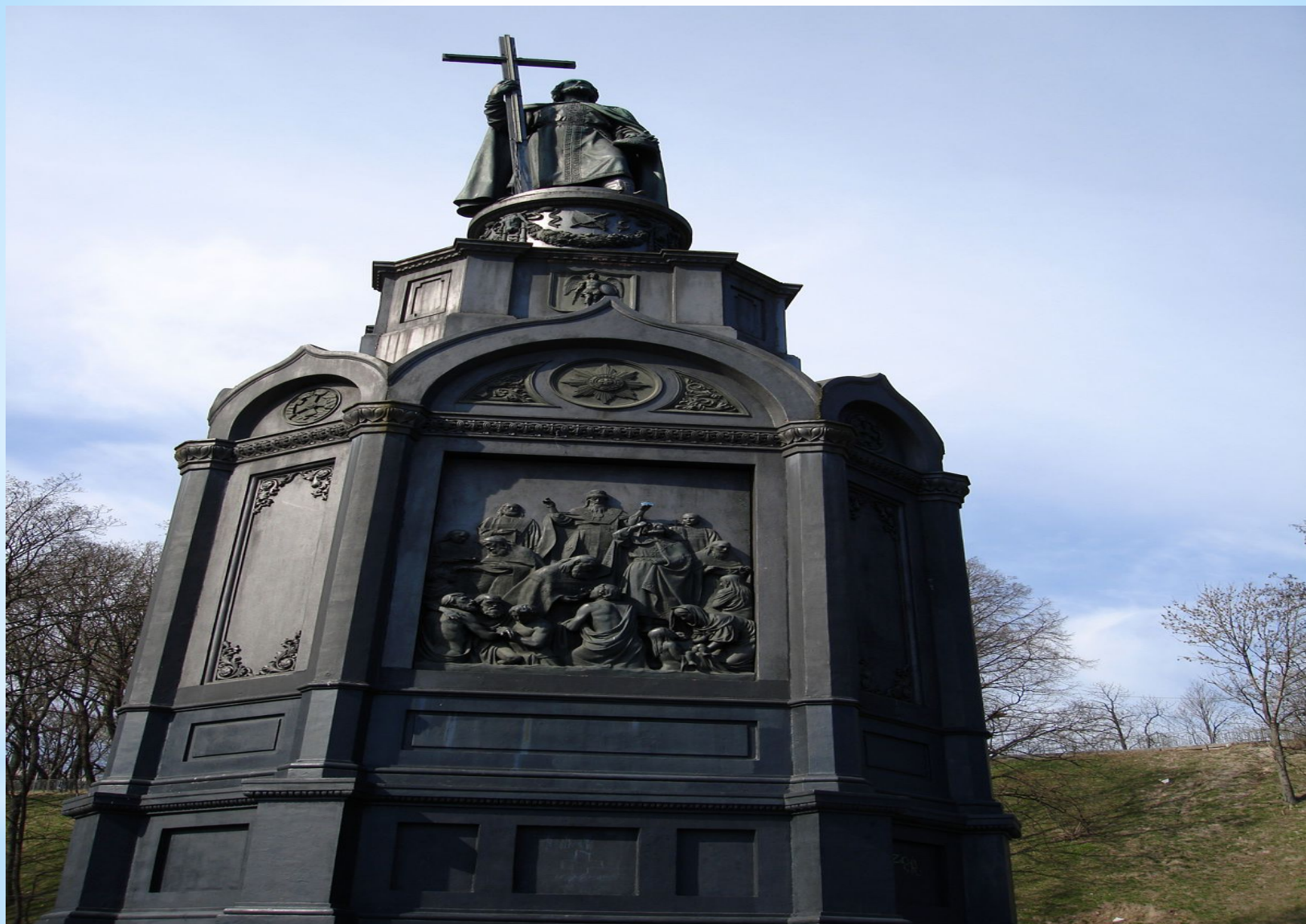
Памятник Владимиру в Киеве