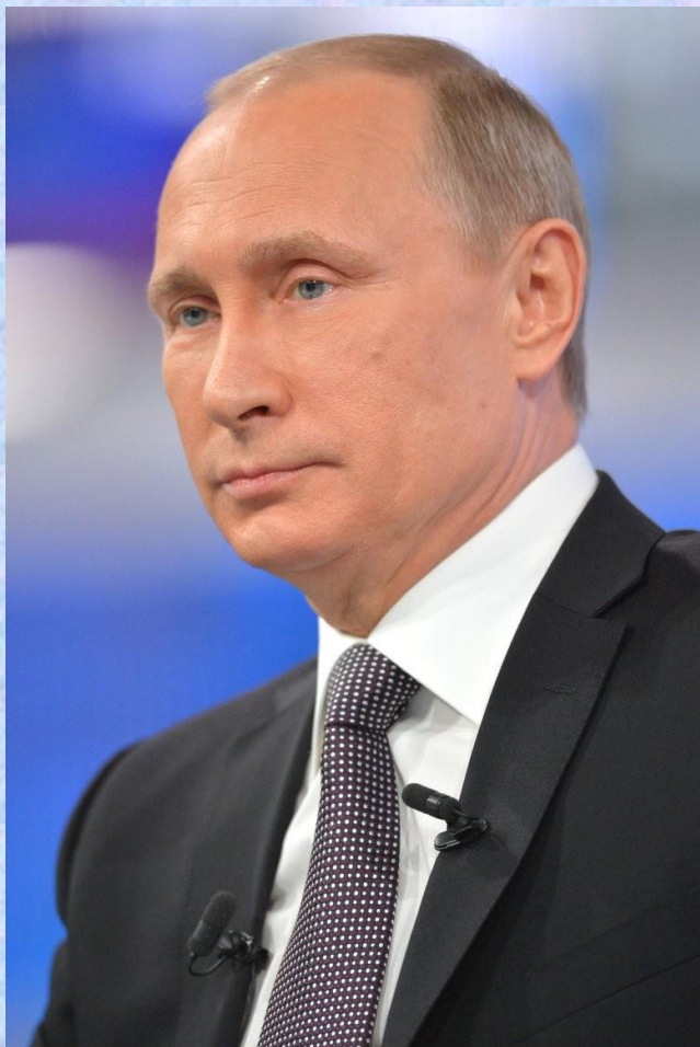
Президент России В. В. Путин