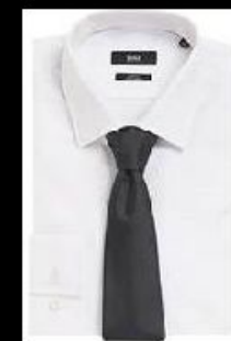
Сорочка белая Галстук серых оттенков