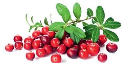
Клюква - кlyukovka