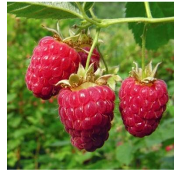
Малина - малинка