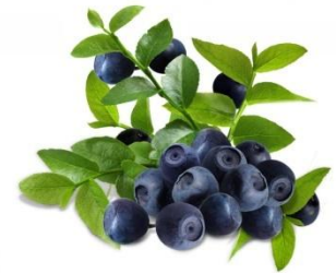
Черника - черничка