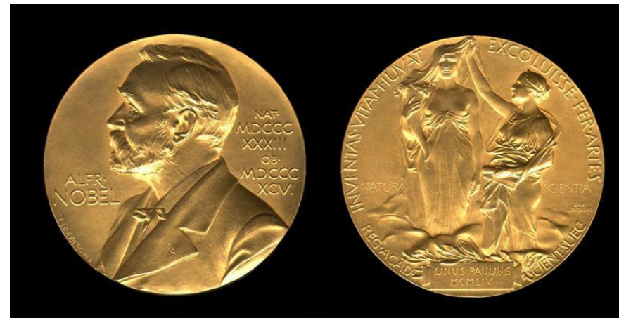
Медаль, вручаемая лауреату Нобелевской премии