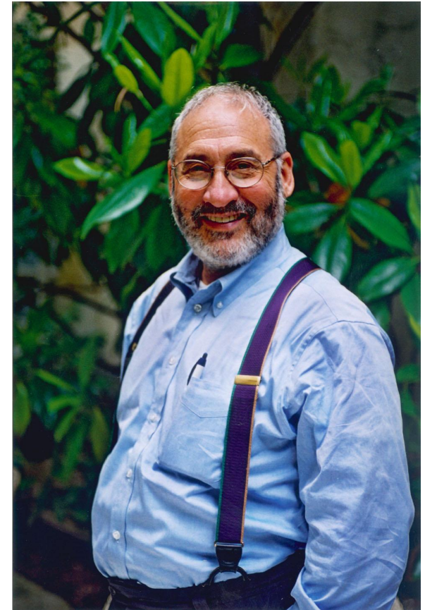
Стиглиц Джозеф Юджин