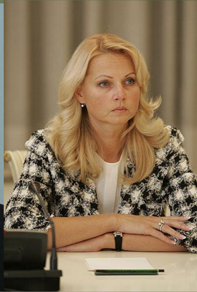
Председатель Счётной палаты Российской Федерации Т. А. Бузикина