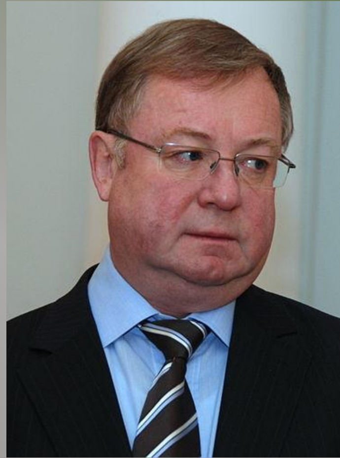
Экс-председатель Счётной палаты Российской Федерации (2000—2013) С. В. Степанов