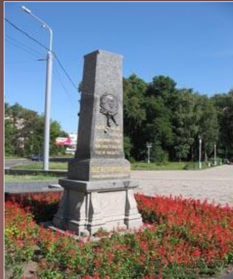
Могила І.П.Котляревському у Полтаві