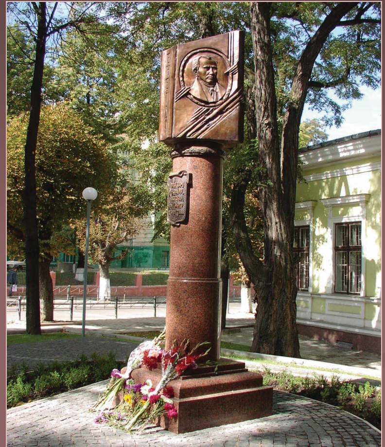
У 2004 році пам'ятник літописцям Русі-України, подвижникам українського письменства з барельєфом І. П. Котляревського і написом «Енеїда» відкрито у Чернівцях (скульптор В. Гамаль)