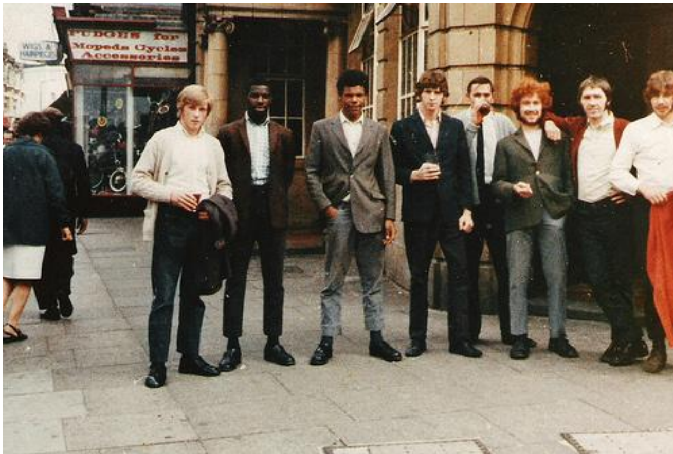
Скинхеды «первой волны», 60-е годы XX века