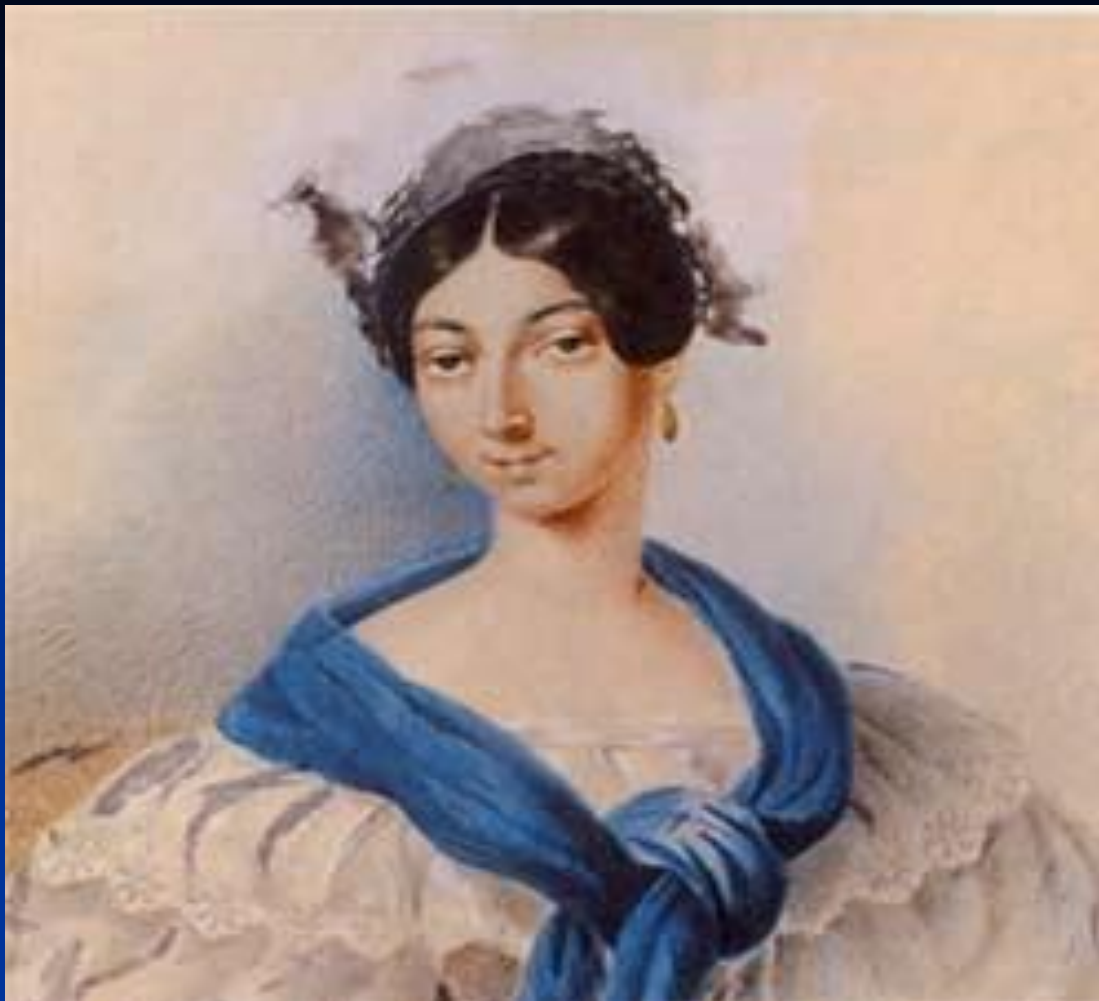
Павлицева Ольга Сергеевна, рожд. Пушкина (1797-1868) — сестра поэта.