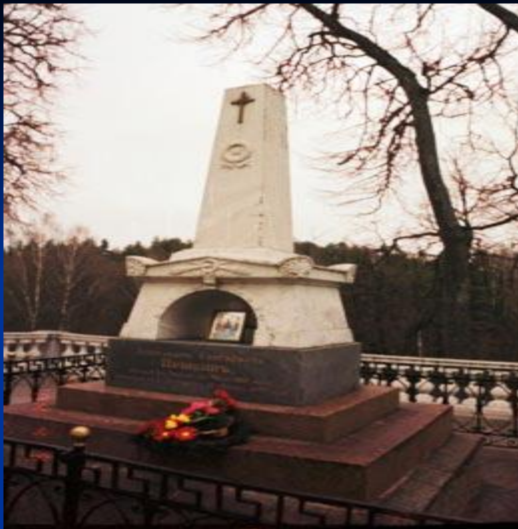
Могила А.С. Пушкина.