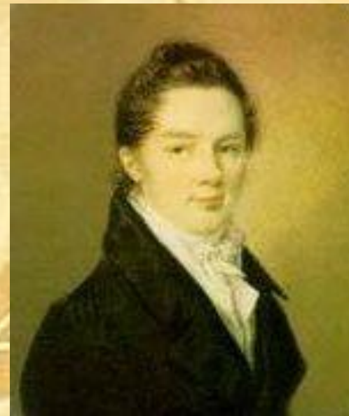
Иван Иванович Пуцин

Пушкин сохранил лицейскую дружбу и культ Лицея на всю жизнь.