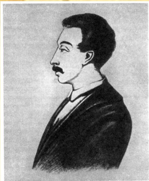
Вильгельм Карлович Кюхельбекер