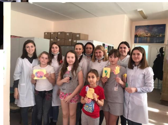
Проведение мастер - классов, приуроченных международному женскому дню и Дню защитника Отечества