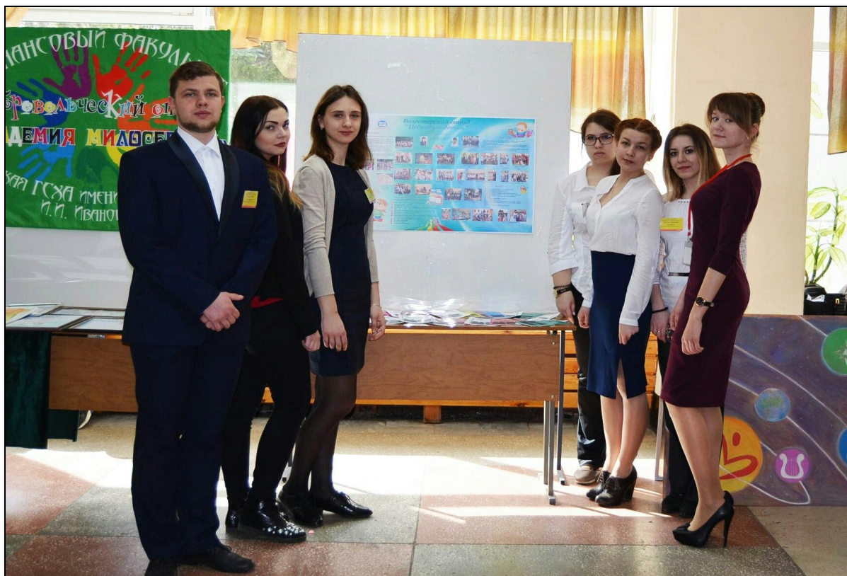
Члены отряда на V Всероссийском форуме «Профессионально ориентированное волонтерство: актуальное состояние и перспективы»