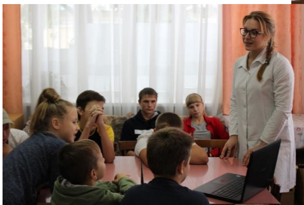
Игровые лекции для детей о правильном питании на базе ОБУЗ ОДКБ 2017 – 2018 гг.