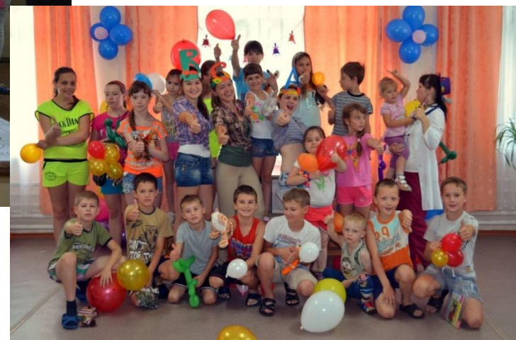
Новогодний спектакль на базе ОБУЗ ОДКБ Постановка спектакля «Весенняя сказка» на базе ОБУЗ ОДКБ