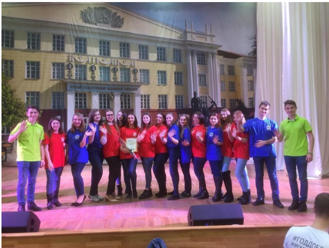
Победа в конкурсе «Доброволец года КГМУ» 2018