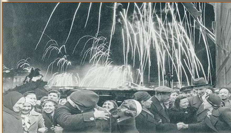
-БЕЛКАЯ ПОВЕДА ОДЕРЖАНА СОВЕТСКИМИ ВОЙСКАМИ ПОД ЛЕНИНГРАДОМ: