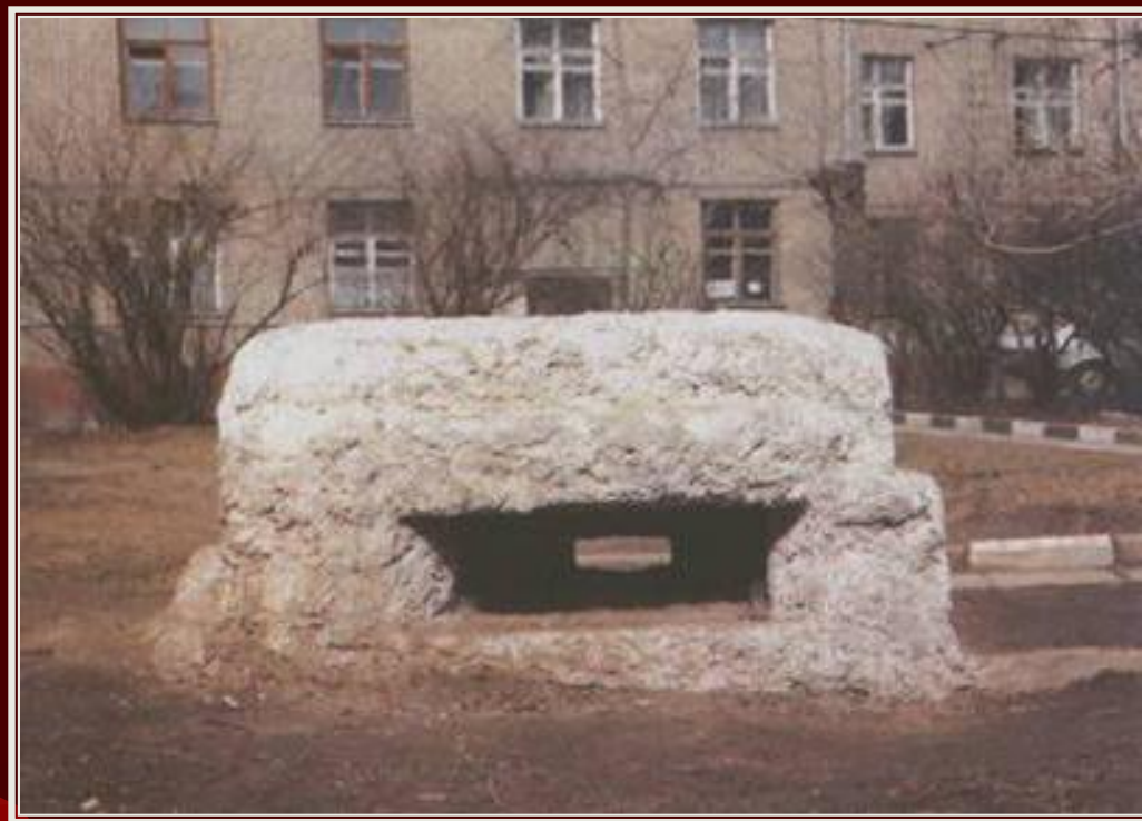
Дот в одном из дворов у ст.м. Калужская

Этой весной в столице отмечается 65-летие победы в Великой Отечественной Войне – одного из знаменательных событий в истории нашей страны. Битва за Москву заложила основу будущей победы. Оборона Москвы шла с начала сентября по 6 декабря. Город был почти пуст, работали только заводы и госпитали. Одним из таких госпиталей была нынешняя больница святителя Алексия, о жизни которой в период битвы за Москву мы знаем из дневников и личных воспоминаний ветеранов.