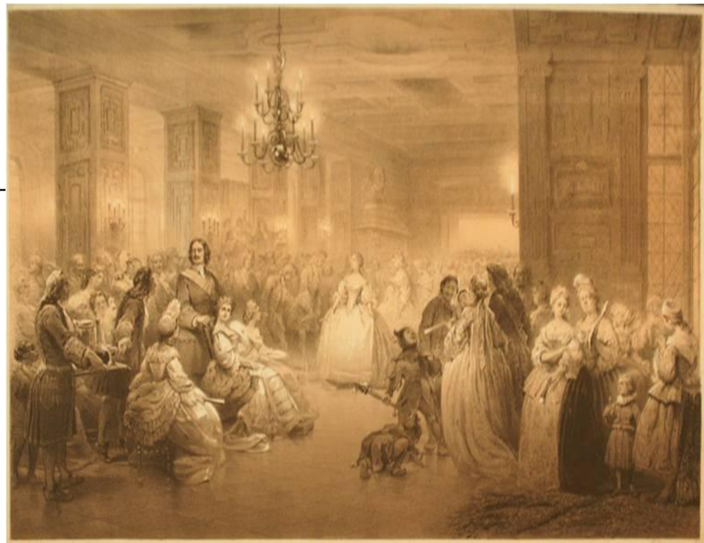
Ассамблея при Петре I

Въ первыхъ наипаче всего должны дѣти отца и ма- терь въ великой чести содержать. И когда отъ родителей что имъ пріказано бы- ваетъ, всегда шляпу въ рукахъ держатъ, а предъ ними не вѣдвоятъ, и возлѣ ихъ не садятся; и прежде оныхъ не засѣдаютъ, при нихъ во окно всѣмъ тѣломъ не выглядывать, но все поаеннымъ образомъ А съ великимъ