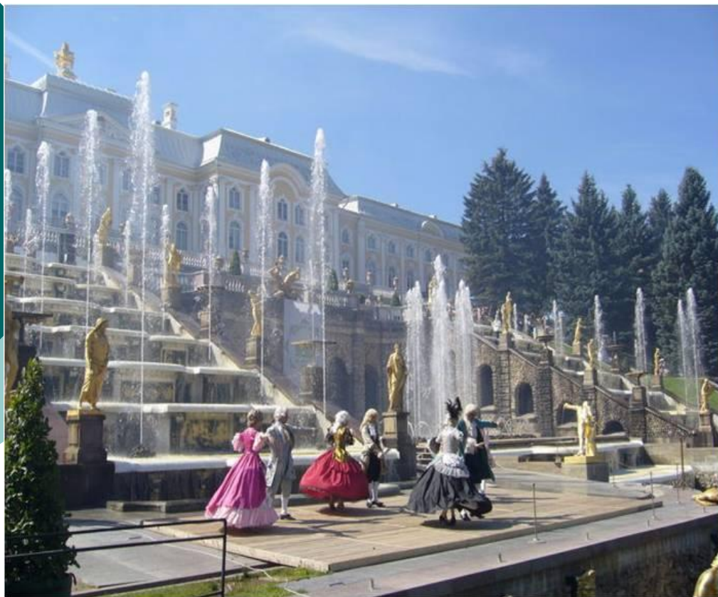
Сооружение императорского дворцового ансамбля в Петегорфе