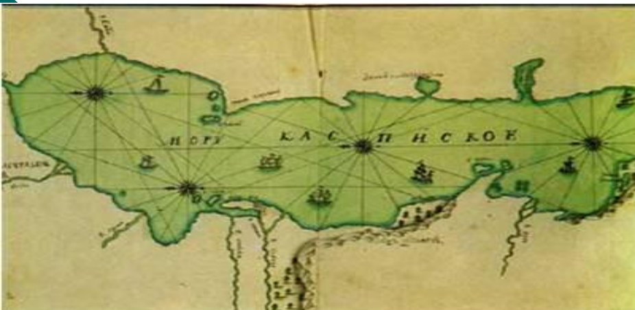
I карта Каспийского моря в России