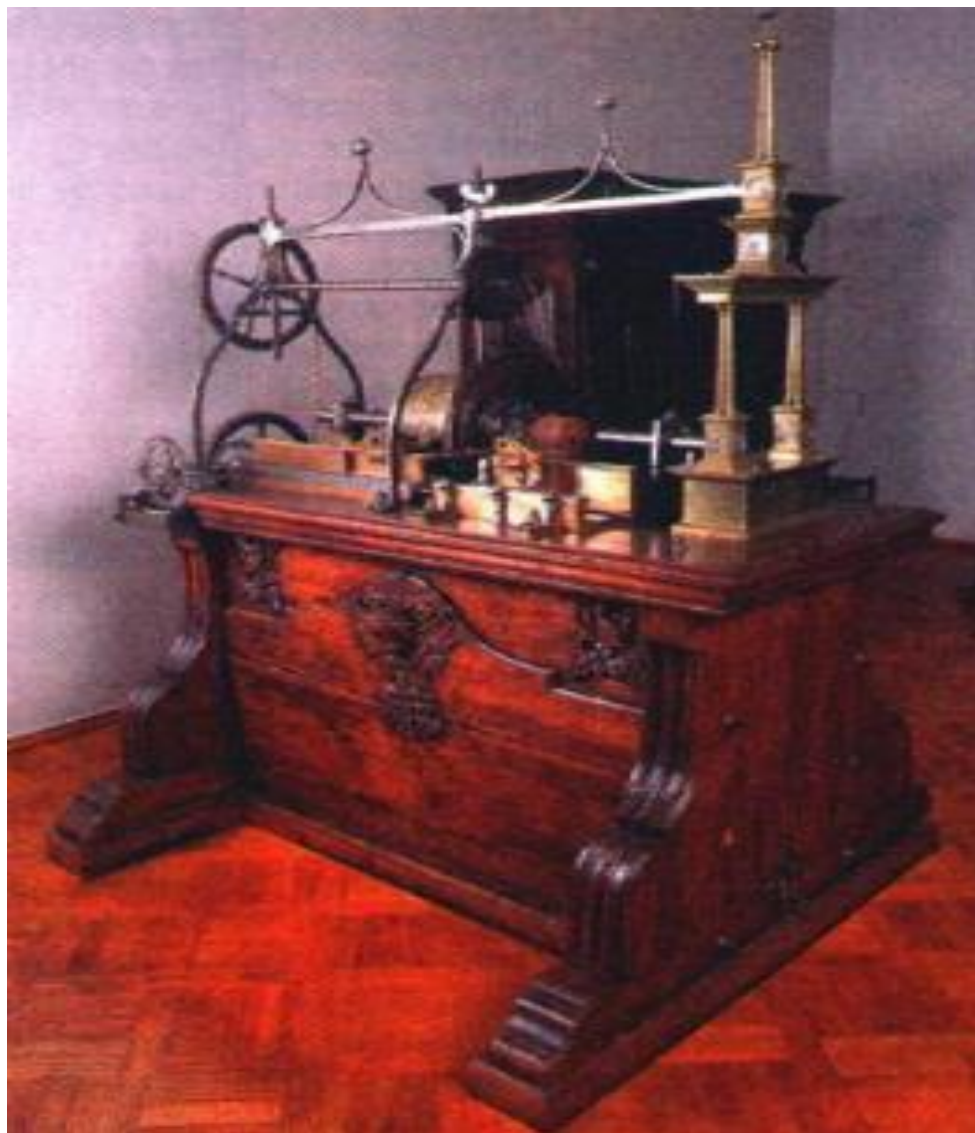
Токарный станок А.Нартова