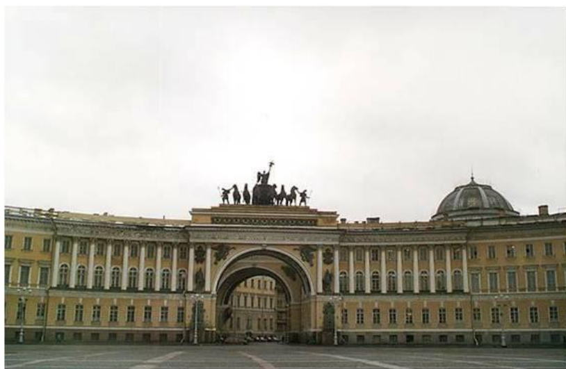
Здание Двенадцати коллегий