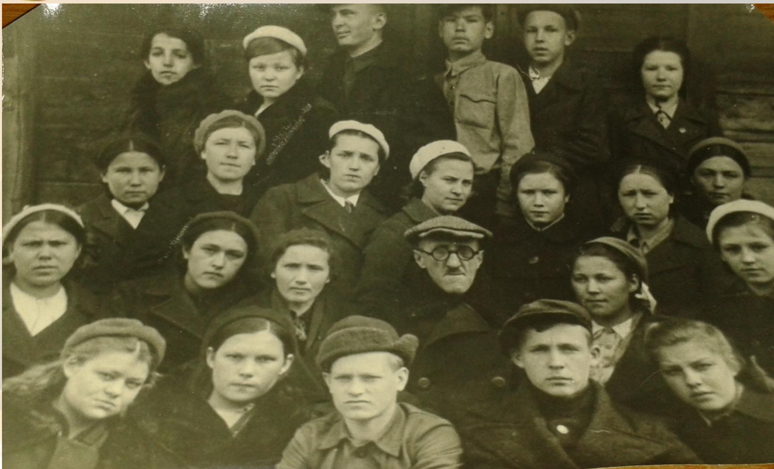
Выпускники школы 1943 – 1944 гг.