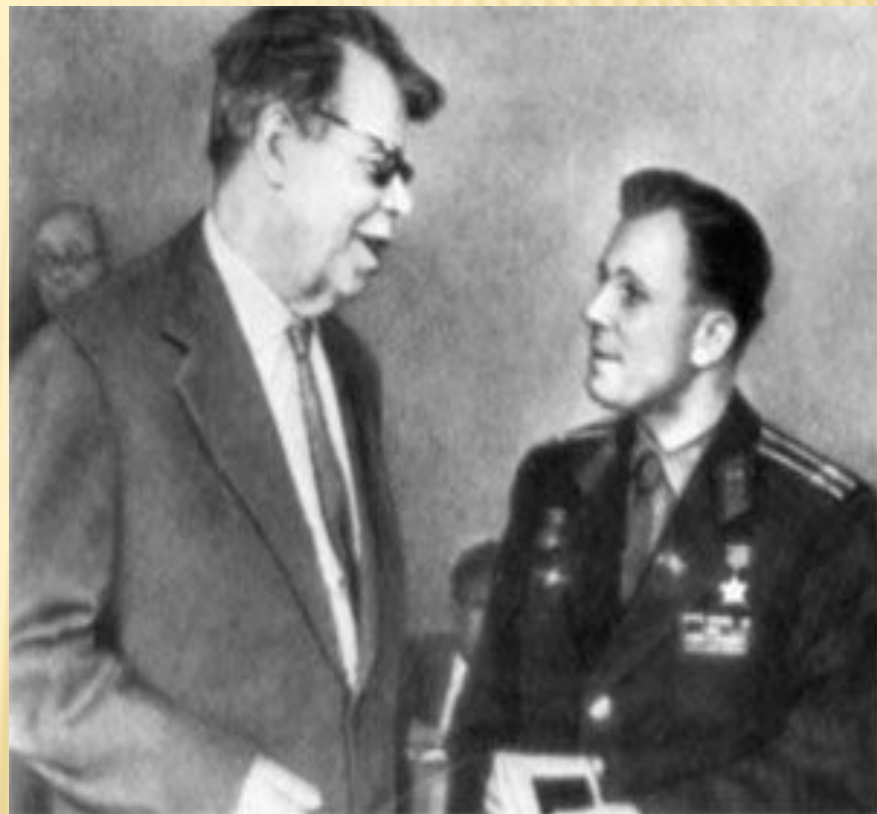
Михаил Исаковский и Юрий Гагарин.

В последние годы Михаил Васильевич занимался депутатской деятельностью – он был депутатом Верховного совета.