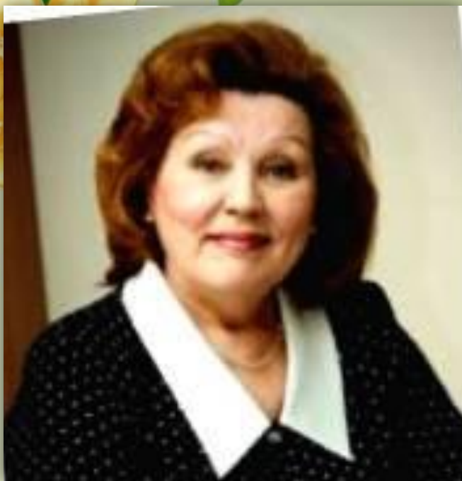
ЛАСТОВКА –ОКУНЕВА ГАЛИНА ТРОФИМОВНА, певица – звание «Заслуженная артистка России», «Народная артистка Татарстана», «Народная артистка Марий Эл»