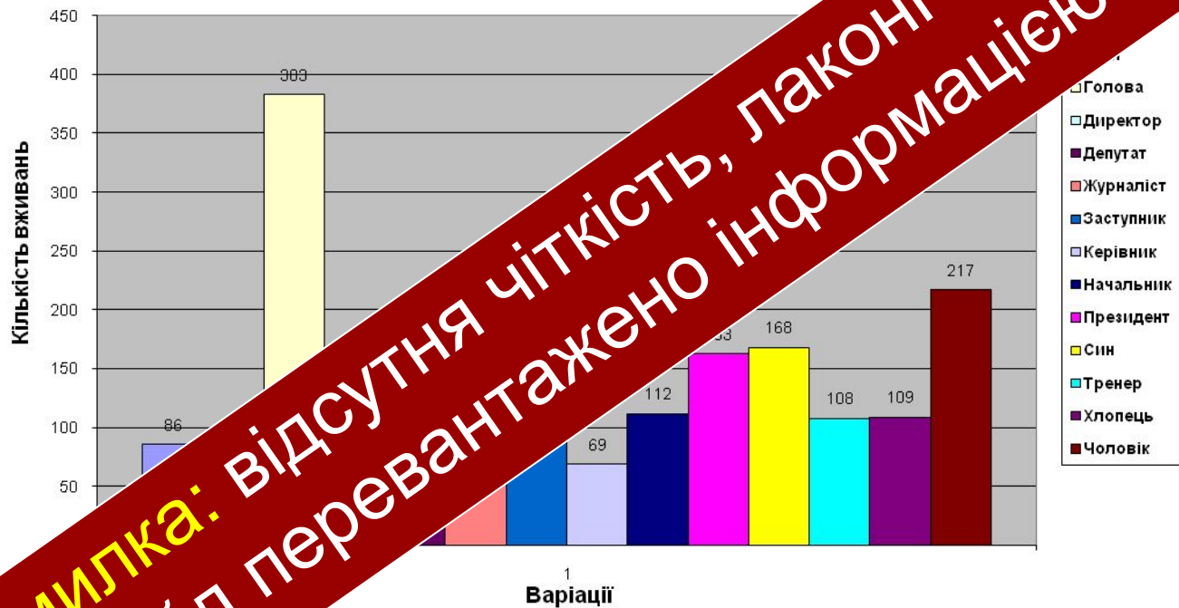
Частотність найбільш вживаних концептів у регіональному виді "Волинь"

Помилка: відсутня чіткість, лаконічність, слайд перевантажено інформацією