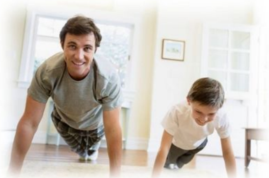
Пресс-служба администрации Частинского муниципального района