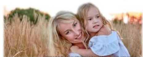
Пресс-служба администрации Частинского муниципального района