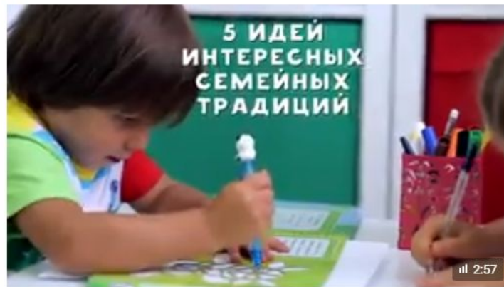
5 идей интересных семейных традиций [Любящие мамы]