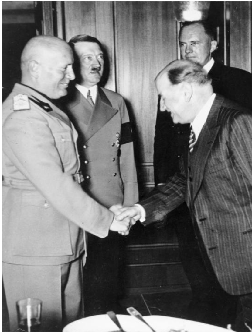
20. September 1938