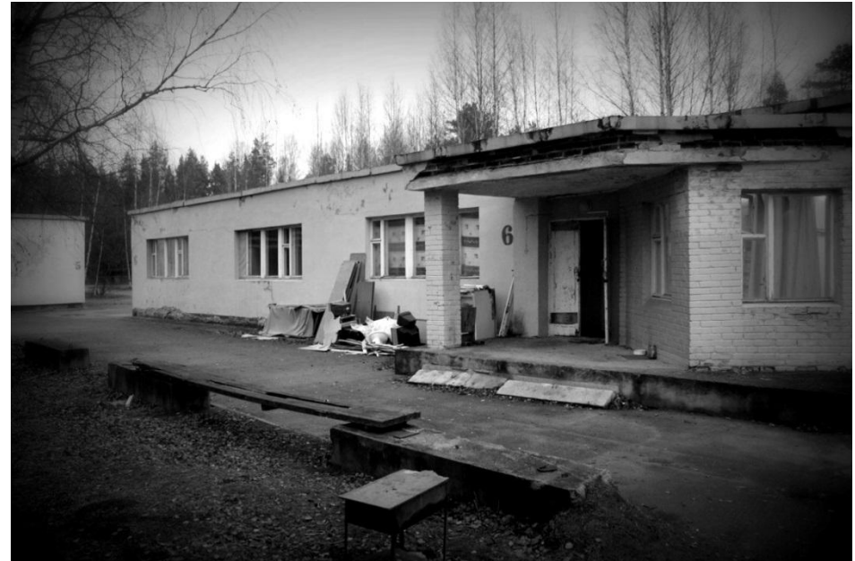
Лагерь «Салют» в 2016 году