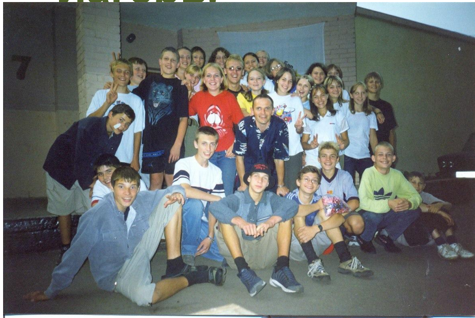
Лагерь «Салют» в 2002 году