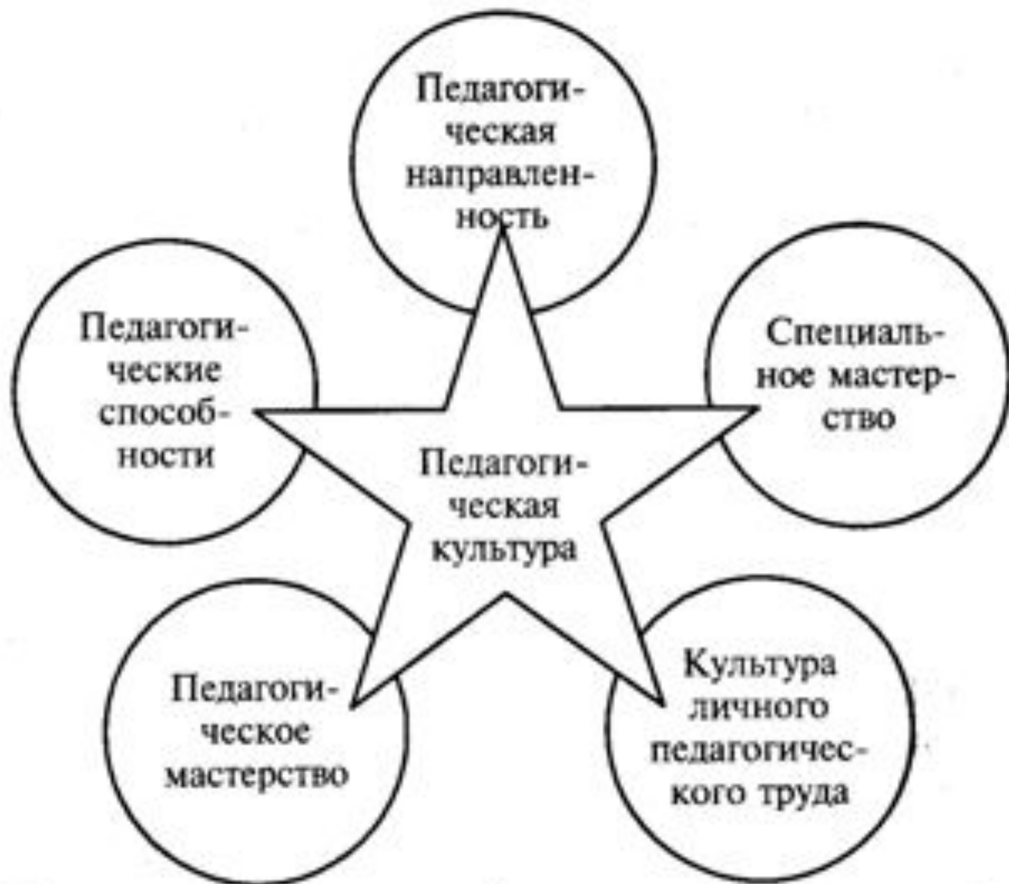
Основные компоненты педагогической культуры преподавателя