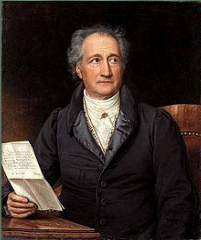
Иоганн Вольфганг фон Гёте

Увертюра – это музыка, которая открывает оперу, драматический спектакль, кинофильм. Во всём мире известна увертюра Бетховена к трагедии Гёте «Эгмонт»