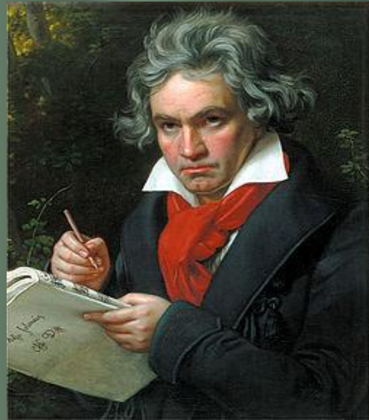
Людвиг ван Бетховен