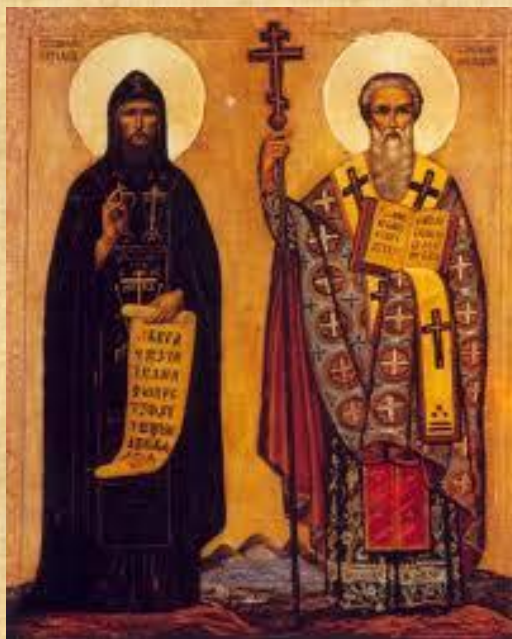
Кирилл и Мефодий