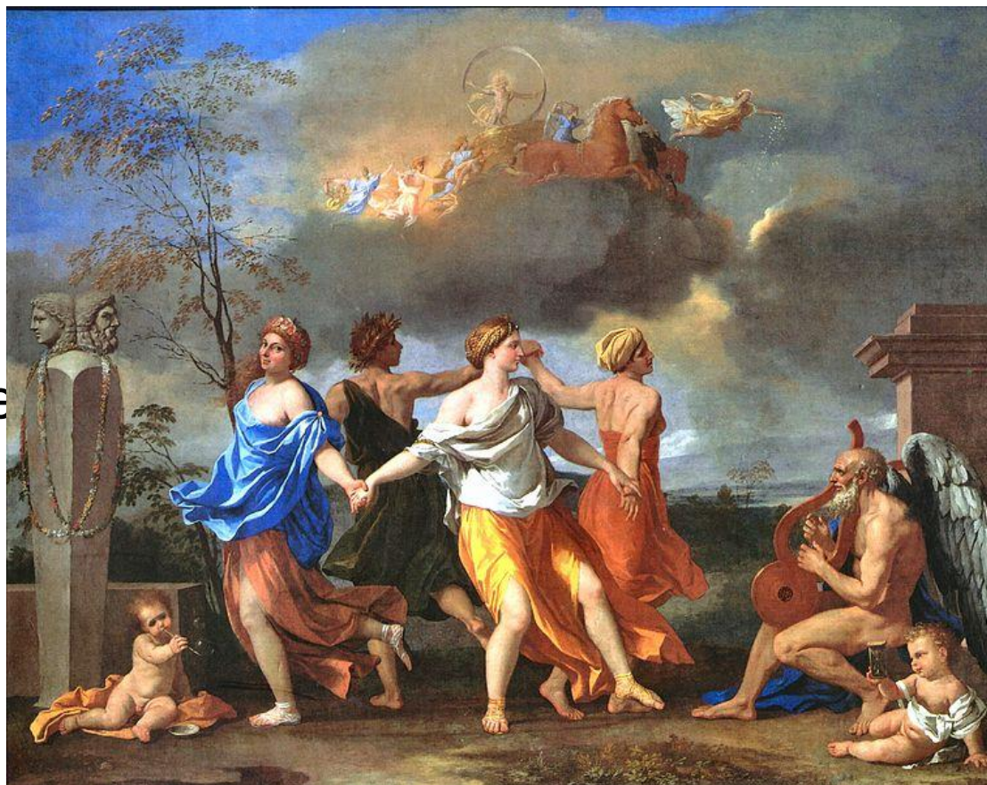
Никола Пуссен «Танец под музыку времени» (1636).

от лат. classicus — «образцовый»-художественное направление в европейском искусстве XVII — XIX вв., ориентированное на идеалы античной классики.