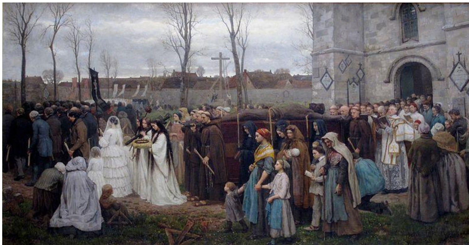
Жюль Бретон. «Религиозная церемония»

Реализм (фр. réalisme , от позднелат. reālis «действительный», от лат. rēs «вещь») — эстетическая позиция, согласно которой задача искусства состоит в как можно более точной и объективной фиксации действительности. Термин «реализм» впервые употребил французский литературный критик Ж. Шанфлёр в 50-х гг.