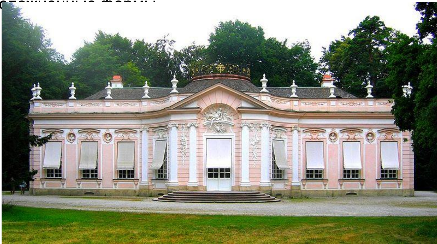
Амалиенбург под Мюнхеном.

Возникшее во Франции, рококо в области архитектуры сказалося главным образом в характере декора, приобретшего подчеркнута изящные, утонченно-устойчивые формы.