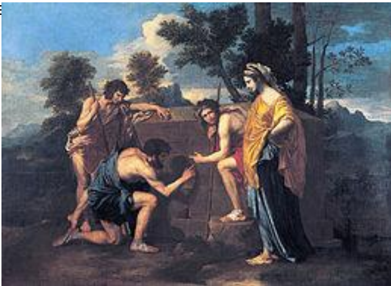
Н. Пуссен «Пастухи Аркадии».1638 -1639 гг. Лувр, Париж

Главными темами искусства классицизма были торжество общественных начал над личными, подчинение чувства долгу, идеализация героических образов