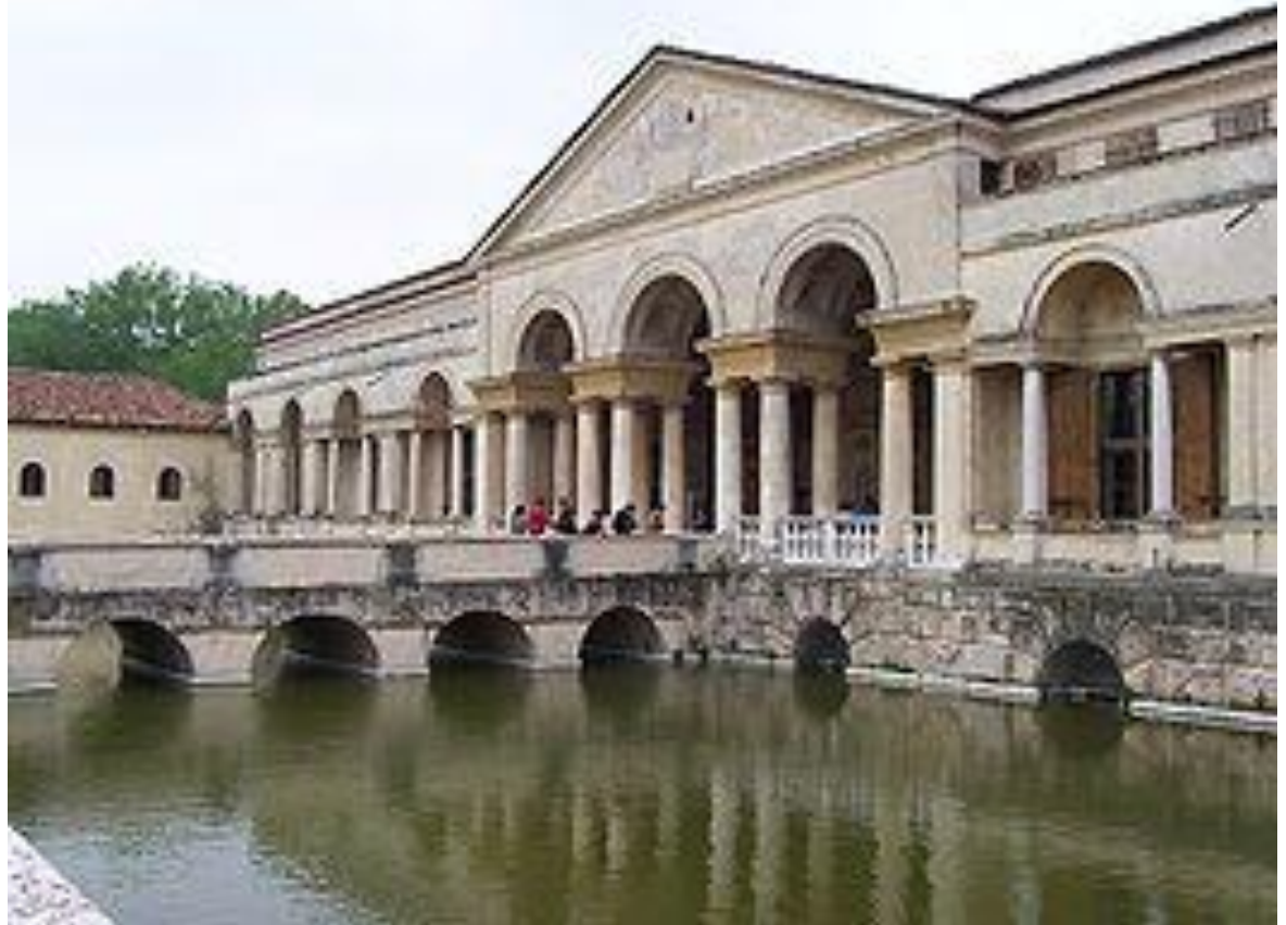
Палаццо дель Те в Мантуе