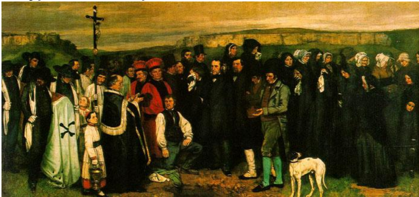
Гюстав Курбе. "Похороны в Орнани". 1849-1850 гг.