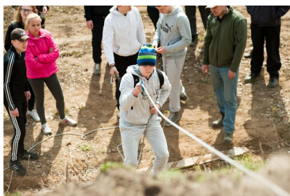
Военно-спортивная эстафета на Конференции АСДГ, 2014г.