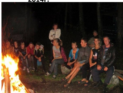
Лагерь «Юный пограничник»

Крайне востребованными являются проекты направленными на патриотическое воспитание и военно-спортивную подготовку, однако, летних проектов, имеющих необходимое материальное обеспечение и набор технологий по работе с детьми, подростками и молодежью всего 2-3(клуб "Рысь", лагерь "Разведчик" и лагерь "Юный пограничник") - в следствие чего есть высокая необходимость тиражирования накопленного опыта и применения технологий для охвата большей части молодежной аудитории.