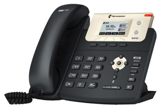
Yealink SIP-T21 E2

Оборудование поддерживает автоматическую настройку, Вам остаётся только подключить телефон к сети