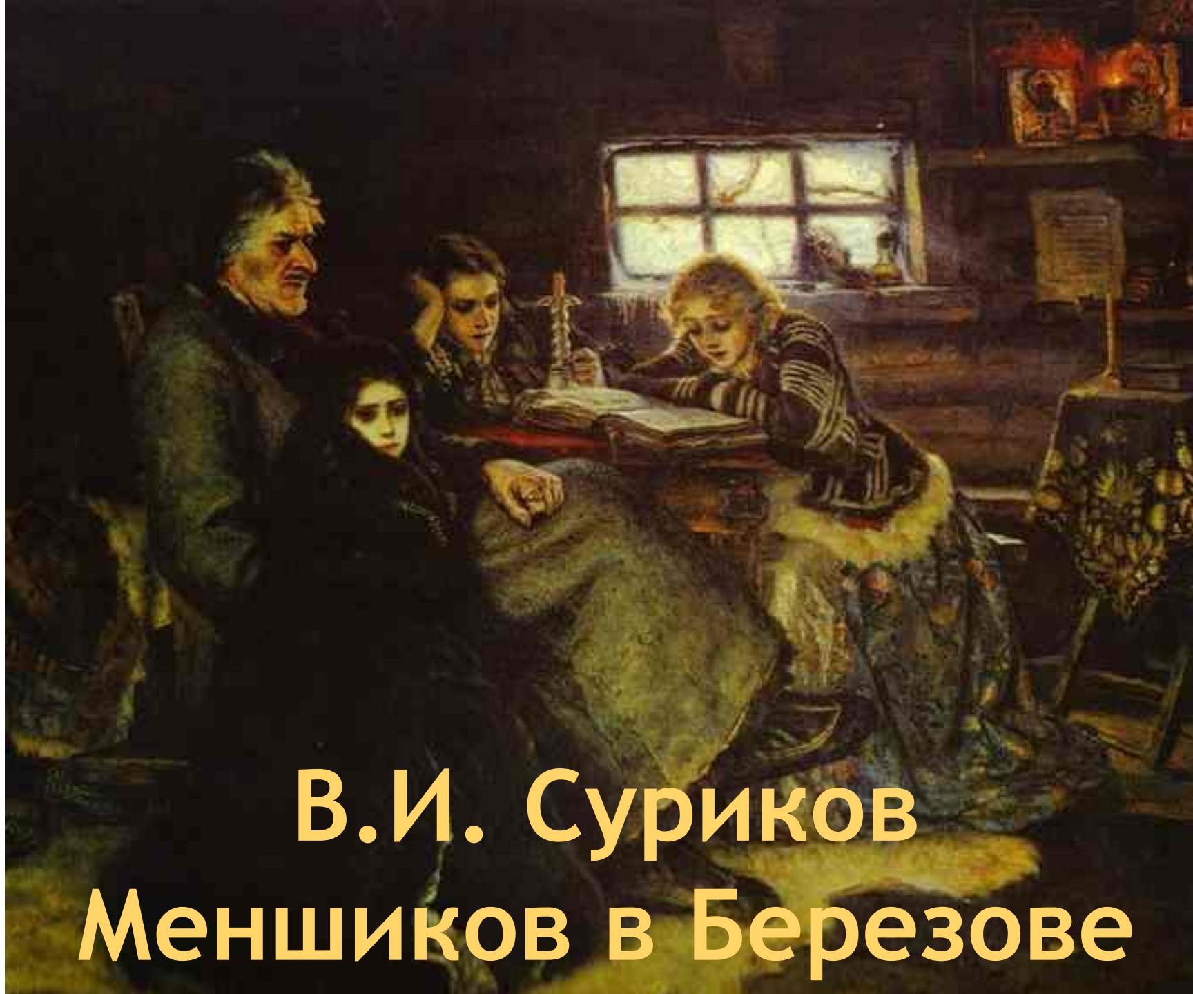
В.И. Суриков Меншиков в Березове