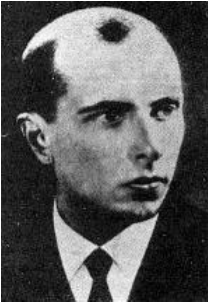
С.Бандера-лидер Украинских националистов.

Война привела к оживлению национальных движений. На Украине в Белоруссии и Прибалтике действовало ок.4000 партизанских отрядов. От их рук погибло 16 тыс. партийных и советских работников. В Молдавии численность подпольщиков составляла ок.1000 человек. Они протестовали против присоединения к СССР и коллективизации. НКВД проводило массовые операции в этих районах и к 1951 г. сопротивление практически было сломлено.