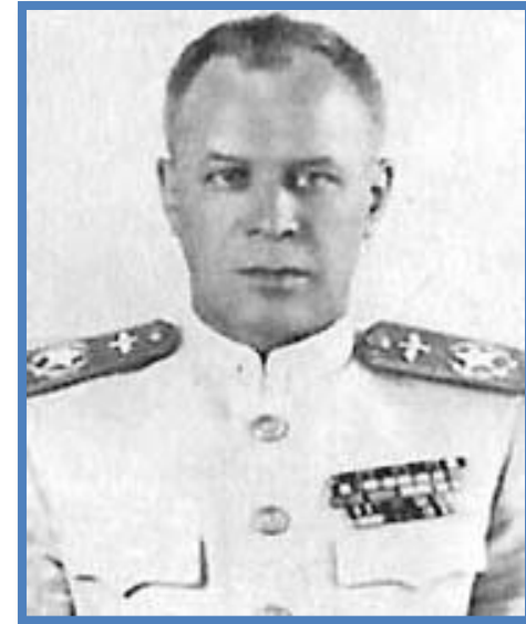
А. А. Новиков

Опасаясь возросшей в ходе войны популярности военных, Сталин санкционировал арест маршала авиации А. А. Новикова, ряда сослуживцев маршала Г. К. Жукова. Самому полководцу были предъявлены обвинения в сколачивании группы недовольных генералов и офицеров, в неблагодарности и неуважении к Сталину.