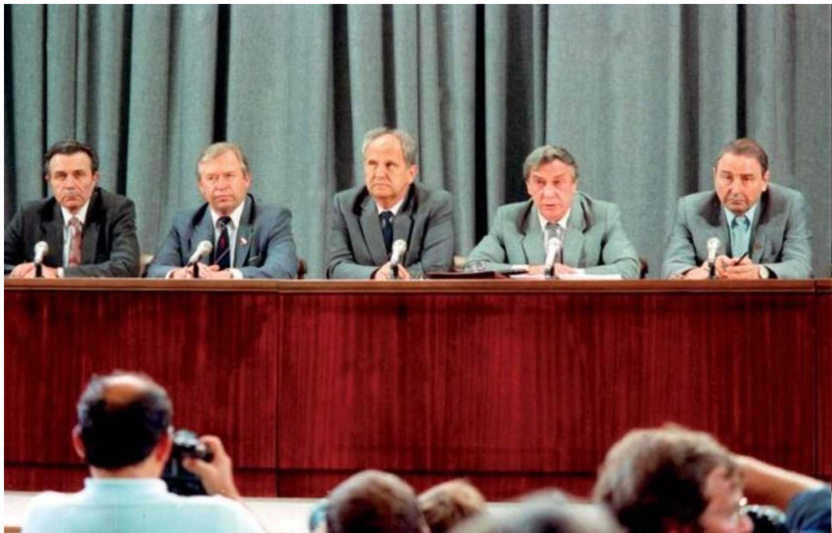
Г.Янаев, В.Павлов, Д.Язов, В.Крючков, Б.Пуго и т.д.