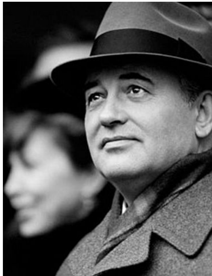
Михаил Сергеевич Горбачев