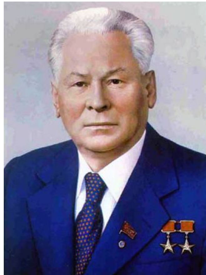
Константин Устинович Черненко

При Черненко окончательно сформировалось и усилило свои позиции крыло в руководстве, которое выступало за более радикальное обновление общества. Возглавил М. С. Горбачев