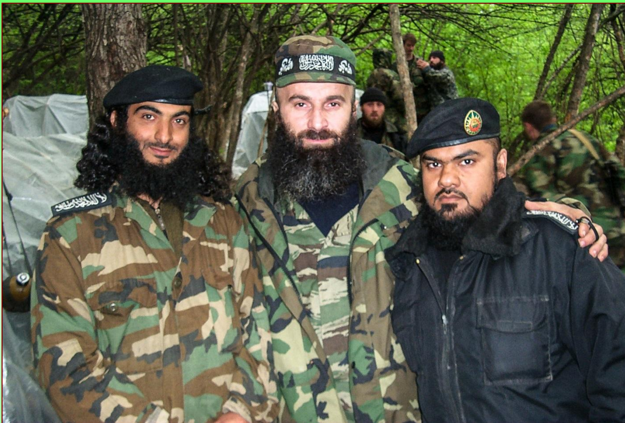
Международные террористы в Чечне в 1990-е гг.

В настоящее время происходит размывание границы между внутренним и международным терроризмом, интернационализация различных аспектов деятельности тех или иных террористических организаций и групп.