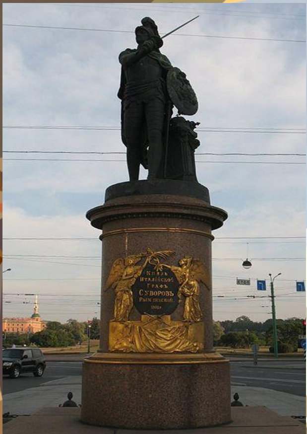
Монумент А.В. Суворову 1799 г.

талантливый русский скульптор-монументалист.