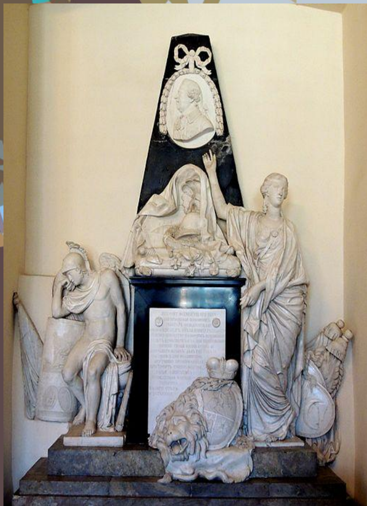
Надгробие Голицина 1744 г.

Русский скульптор, профессор скульптуры, ректор Академии Художеств