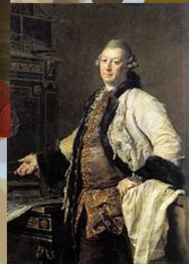
А.Ф. Кокорин ОСНОВАТЕЛИ АКАДЕМИИ