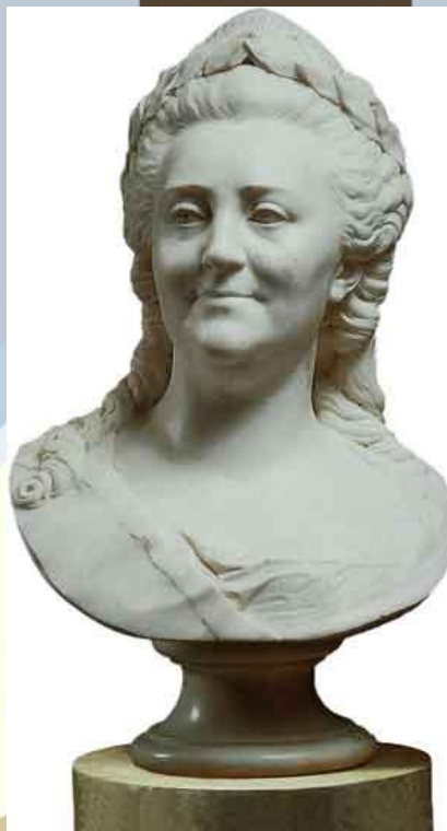
Портрет графини М.Р. Паниной 1770 г.