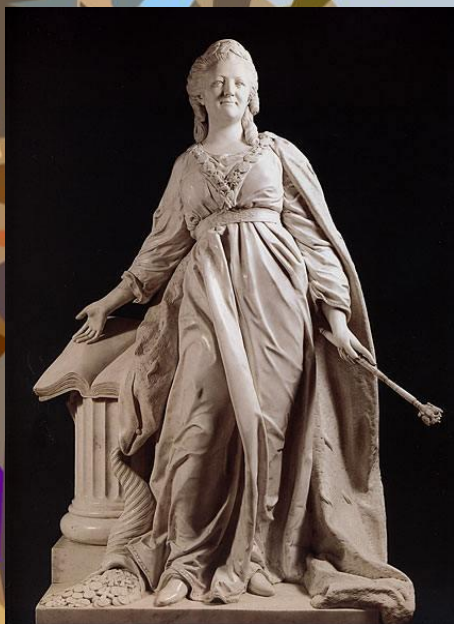
КРУГЛАЯ СКУЛЬПТУ РА

Скульптура - вид искусства, создающий формы в трех измерениях: в высоту, ширину и глубину с использованием различных материалов и особых технологий - высекания, лепки и литья.