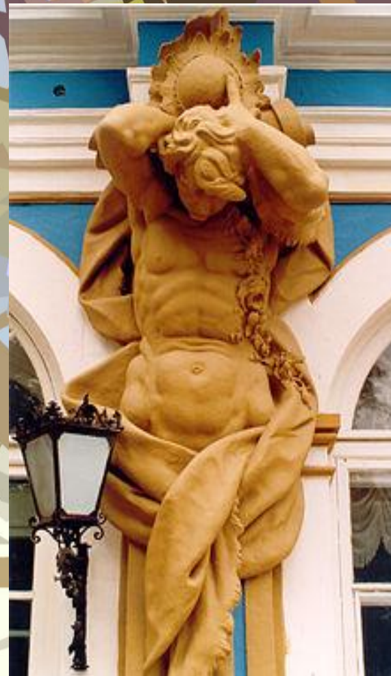
Царскосельский дворец — 1752—1756 годы