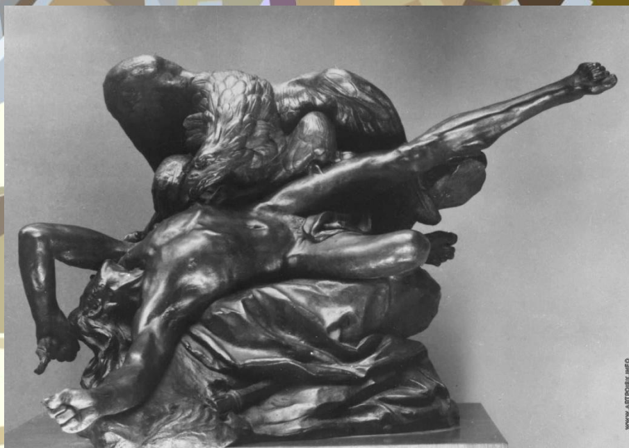
Статуя «Прометей» 1769 г.