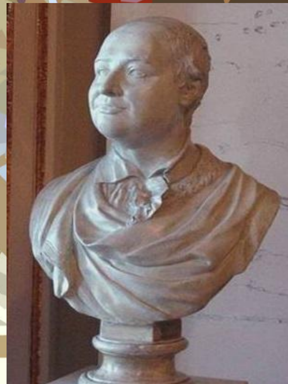
Портрет князя М.В. Ломоносова 1792 г.