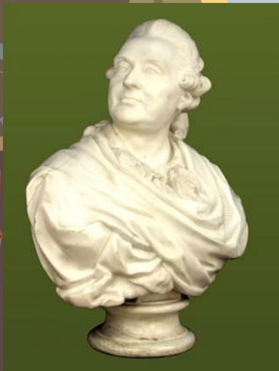
Портрет князя А.М. Голицина 1773 г.

Крупнейший русский скульптор XVIII века, работавший в жанре портрета. Представитель просветительского классицизма в искусстве.