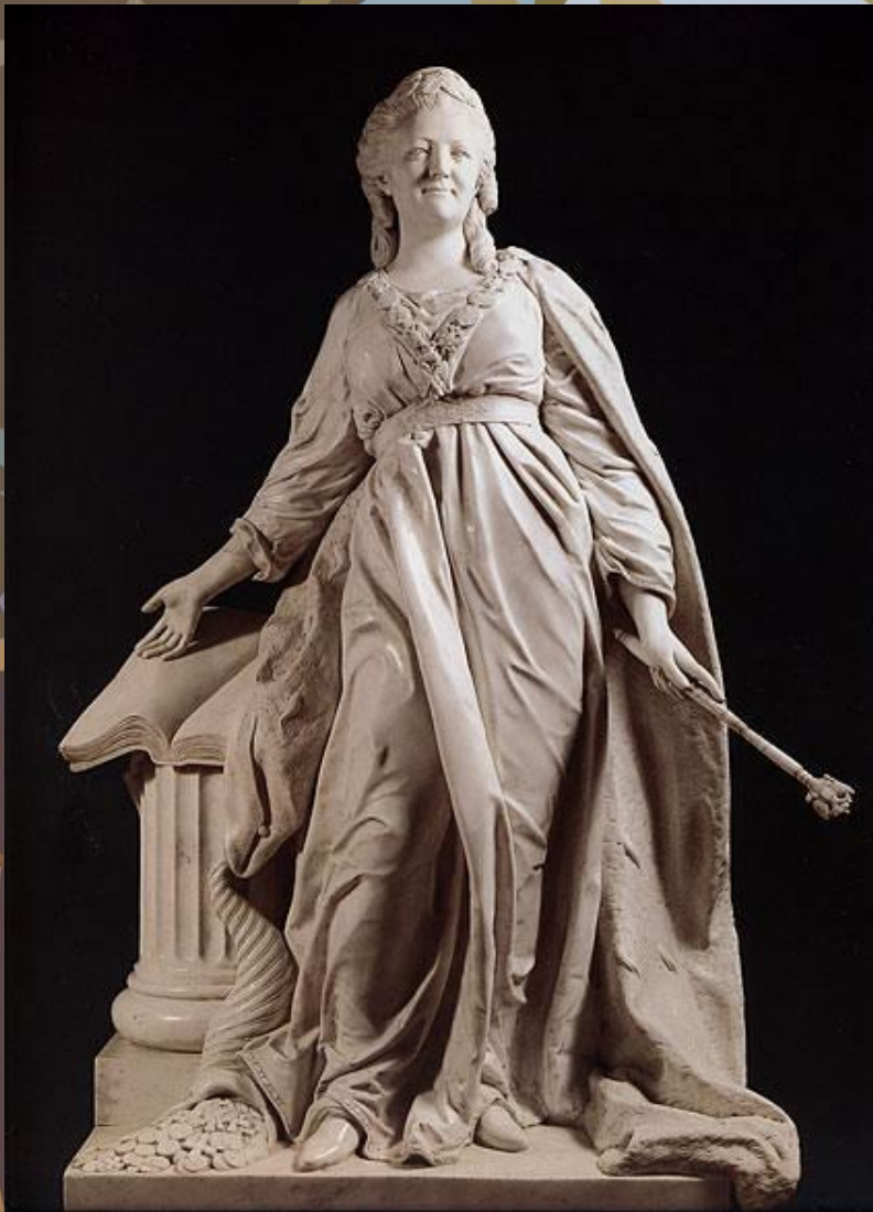
Екатерина II- законодательница 1789-1790 гг