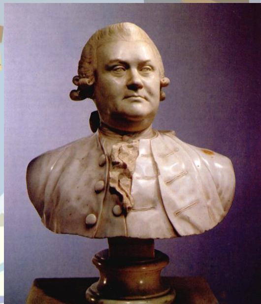
СКУЛЬПТУРН ЫЙ ПОРТРЕТ