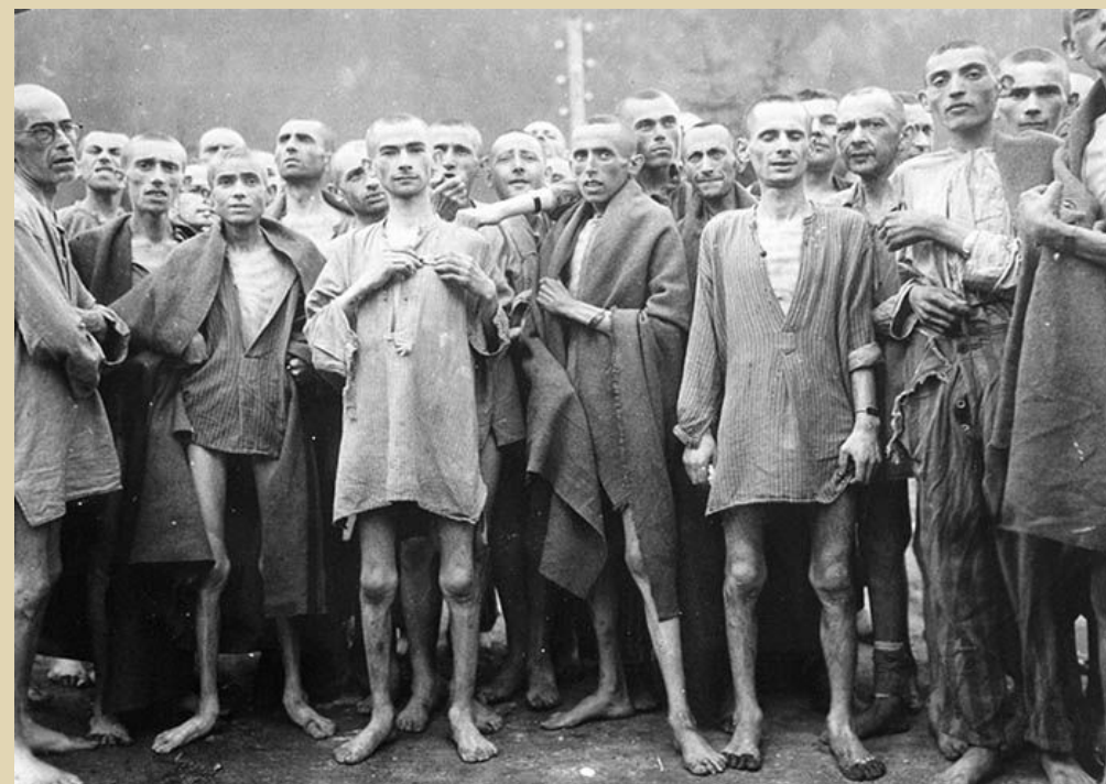
Освобожденные узники лагеря смерти

27 января – Международный день памяти жертв Холокоста. Эта памятная дата призвана напомнить о наиболее последовательном геноциде в мировой истории, она была установлена Генассамблеей ООН и отсылает к событиям, произошедшим в этот день в 1945 г., когда войска Красной Армии освободили несколько тысяч узников Аушвица.