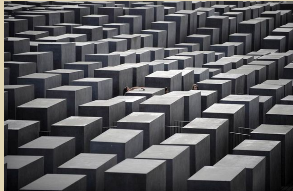
Мемориал жертвам холокоста в Берлине