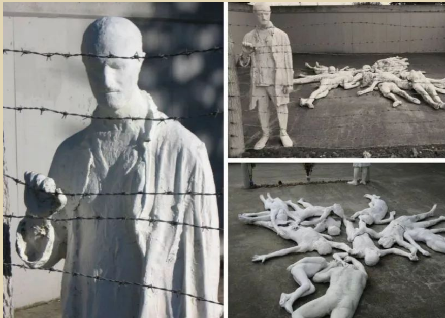
Мемориал «За колючей проволокой» (Сан-Франциско, США)