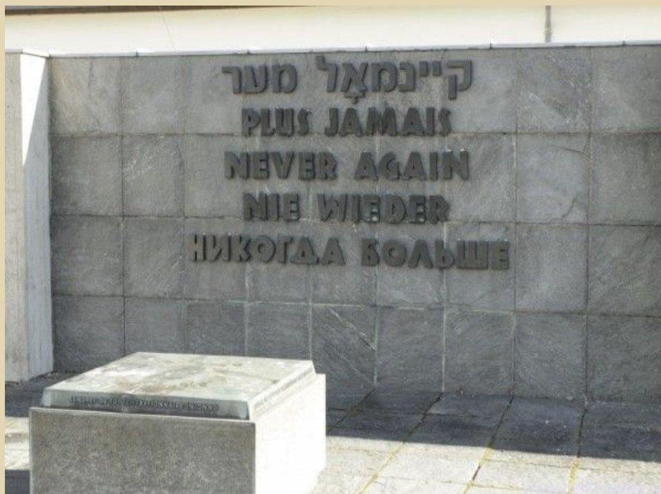
Памятник в Дахау «Никогда больше»