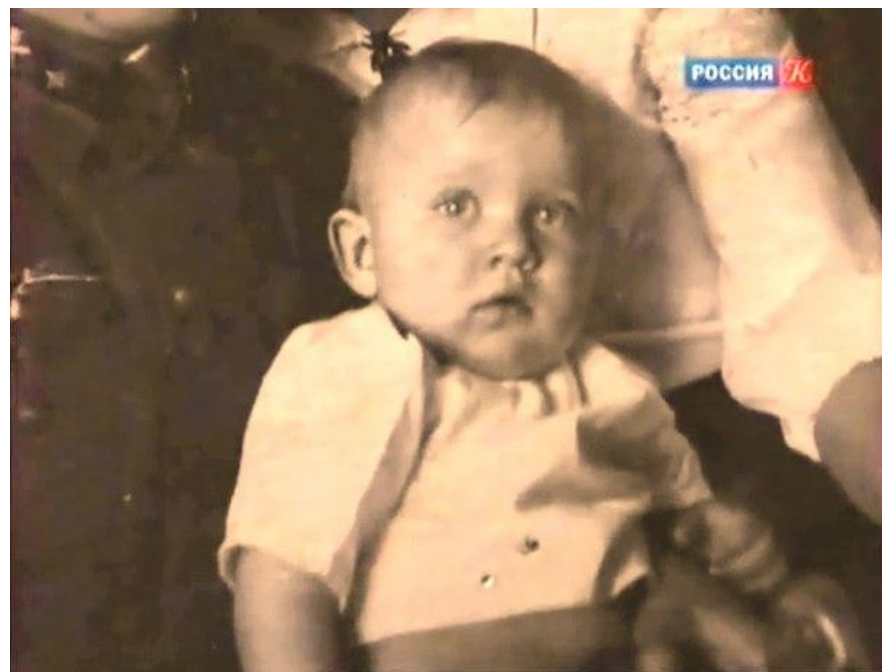
Николай Рыбников в детстве