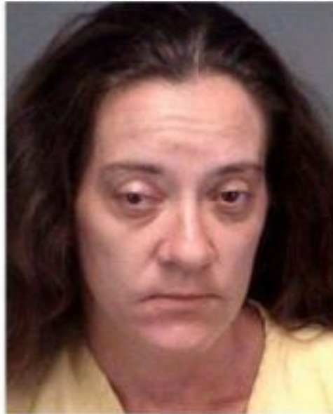
2 AGE: 37