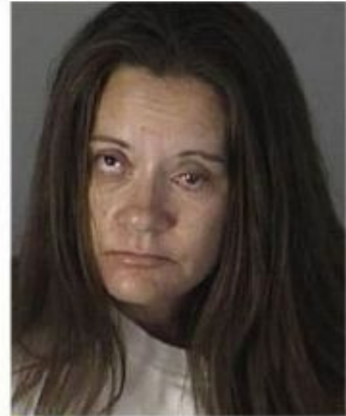
3 AGE: 39