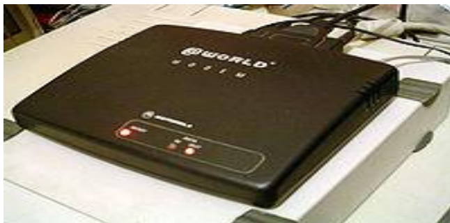
28.8 kbit/s модем Motorola

— Деректерді әр түрлі арқаулар арқылы, мысалы телефон сымы арқылы немесе радиосигналдар түрінде беруге болады. Телефон сымы арқылы аналогтық сигналдар деп аталатын импульстарды беруге болады. Аналогтық сигналдар шуыл немесе электрлік-магнитті импульстар түріндегі кедергілердің әсеріне ұшырауы мүмкін.