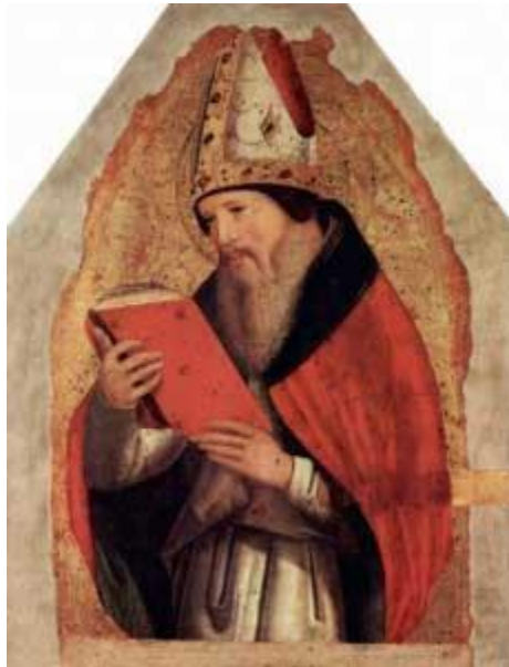
Августин Блаженный (354-430)