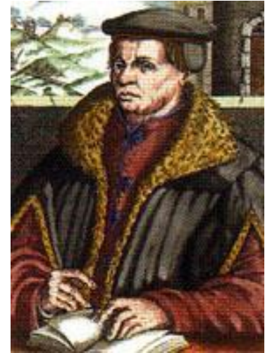
Томас Мюнцер (1489-1525)