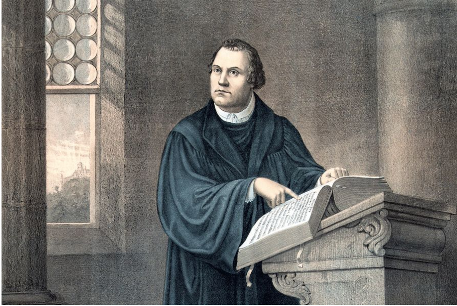
Мартин Лютер (1483-1546)