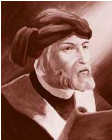
Тертуллиан Карфагенский, христианский богослов и мыслитель (160-220)