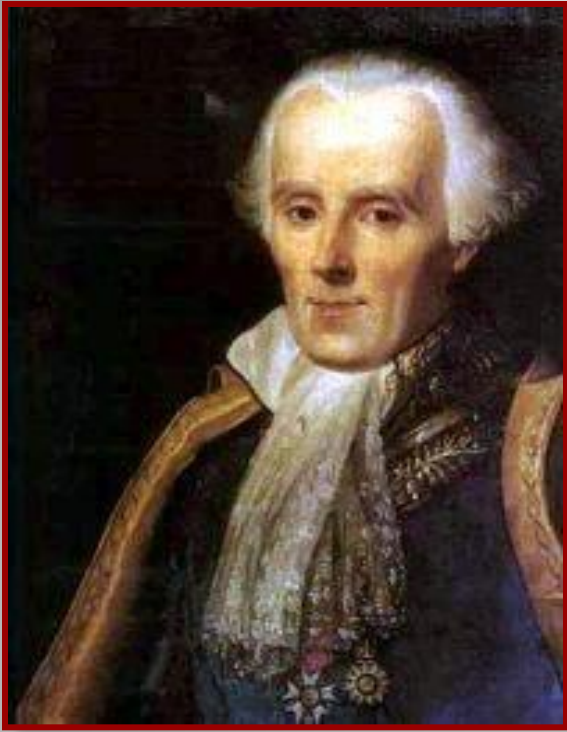
Пьер Симон Лаплас (1749 – 1827 гг.)

«Мысль – выразить все числа немногими знаками, придавая им значение по форме, еще значение по месту, настолько проста, что именно из-за этой простоты трудно оценить, насколько она удивительна ...»