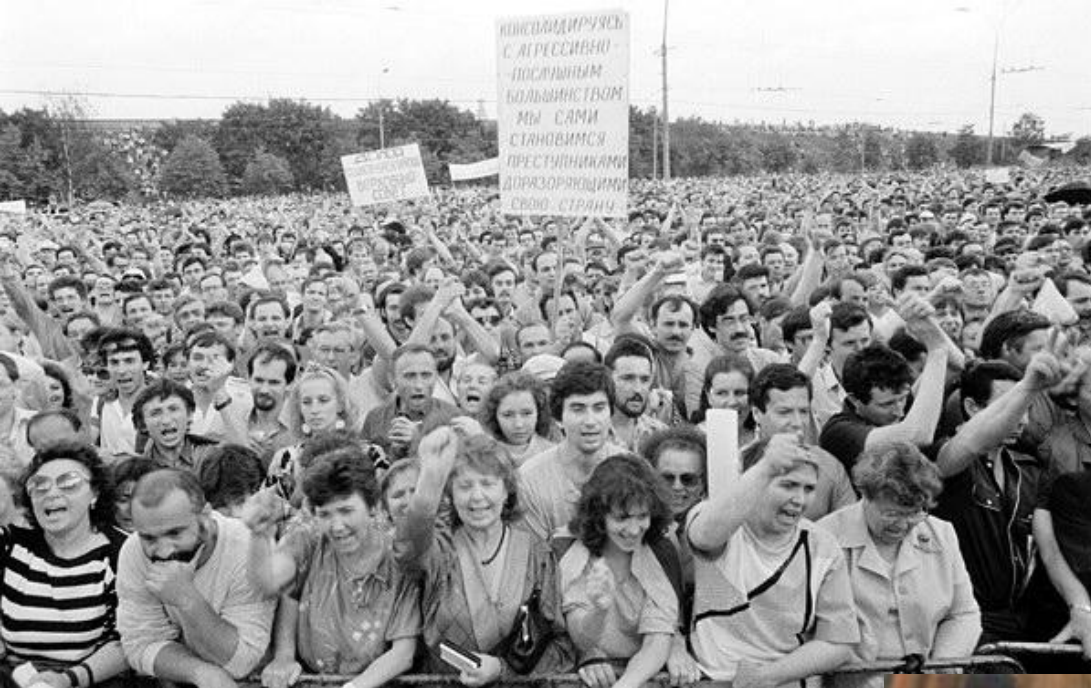
Митинг в Венгрии