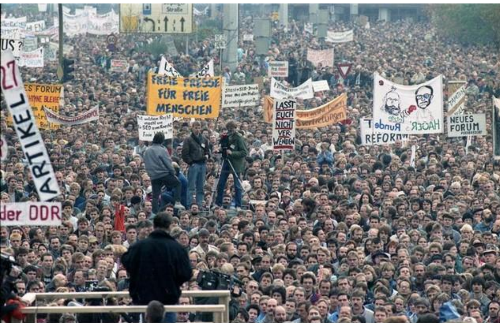
4. November 1989