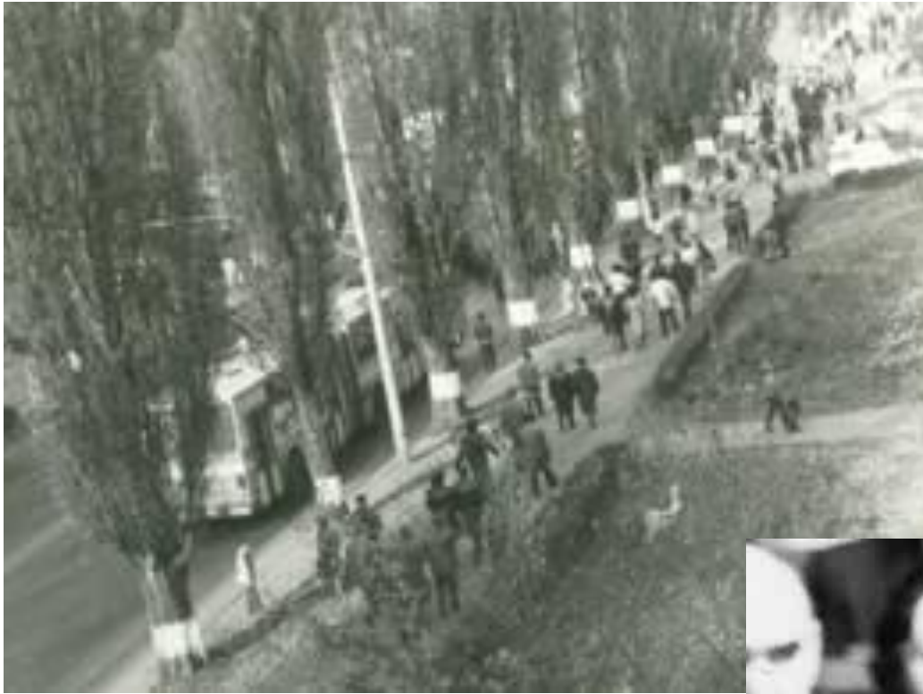
Волнения рабочих в Брашове