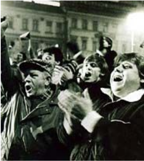
Митинг в Праге