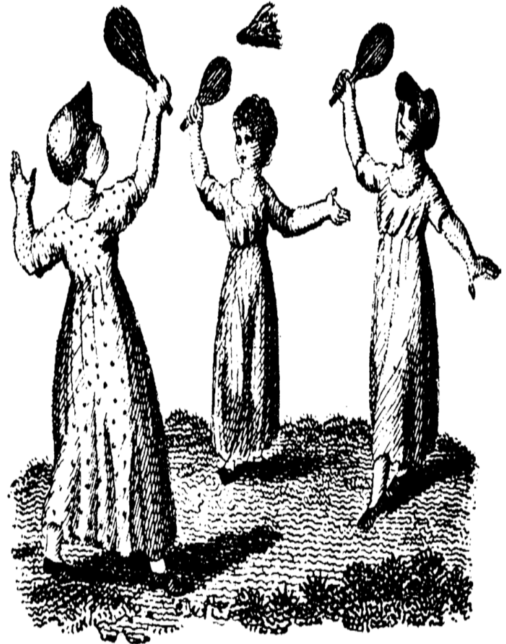
3 Battledore and Shuttlecock.