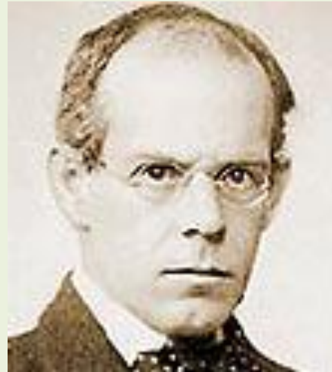
Мак-Кин Джеймс Кеттелл